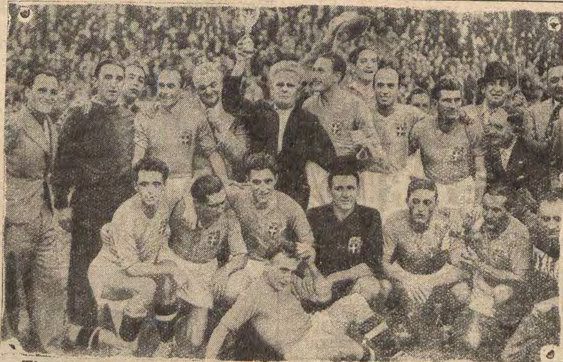
Tim Azura, koji je osvojio po drugi puta prvenstvo svijeta u futbolu.

Sudio je subotički sudac g. Beleslin dobro.