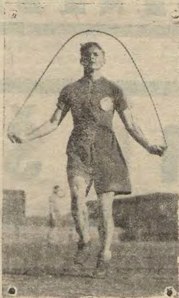
Pleše opet sa uspjehom nastupa u timu „Purgera“