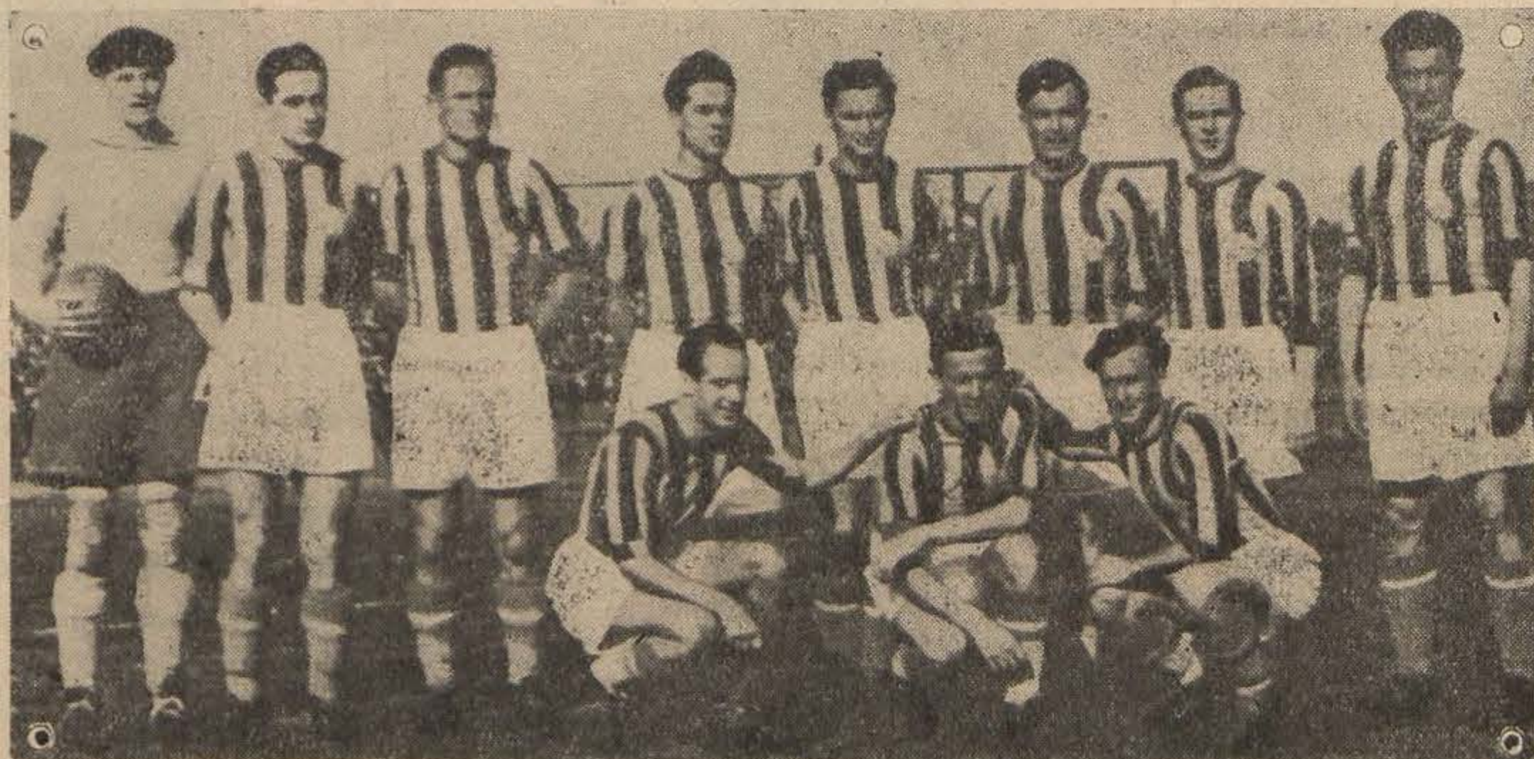
Purgeri — velika momčad