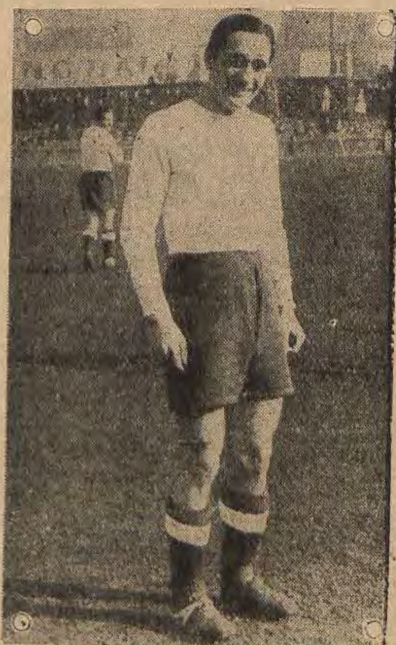
Cimermančić purgerski momak za sve