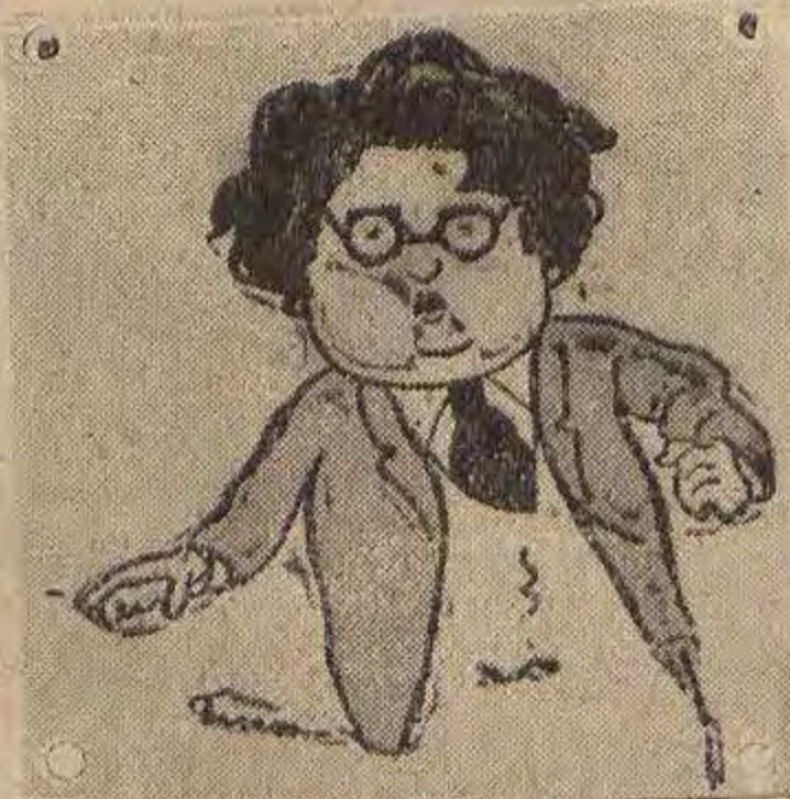
Kosta Hadži ishlapjeli i dotrajali mozak JNS-a

Svi mi moramo dočekati Purgere. Svi mi moramo doći na utakmicu. Svi mi moramo pridonijeti svoj dio za napredak športa u Subotici.