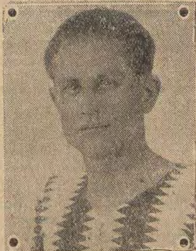
Netoj je bio u nedelju najbolji navalni igrač Bačke.

U samom početku purgeri preuzimaju igru u svoje ruke i oštro navaljuju, Barna nekoliko puta dobro brani, ali ga je u desetom minutu Lešnik primorao da izvadi prvu loptu iz mreže. Bačka igra sasvim nesrijedjeño slabo. Nema nikakve povezanosti između igrača niti pojedinih linija, tako da je svaki napad purgera vrlo opasan. Bačkini igrači previše respektuju svog protivnika što je glavni uzrok takog velikog poraza. U prvom poluvremenu Bačka nijedanput nije