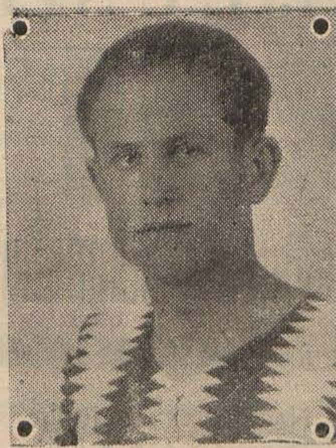
NETOJ NAJBOLJI NAVAS SUBOTICE