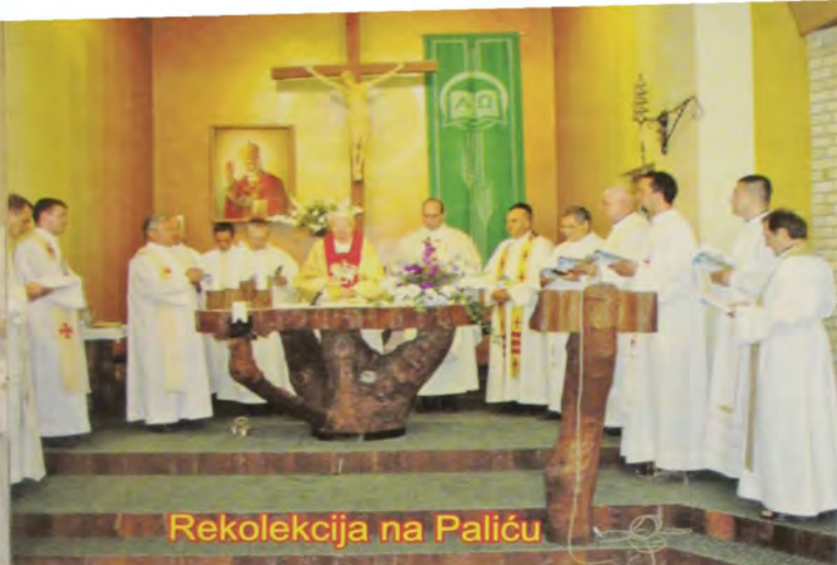
Rekolekcija na Paliću