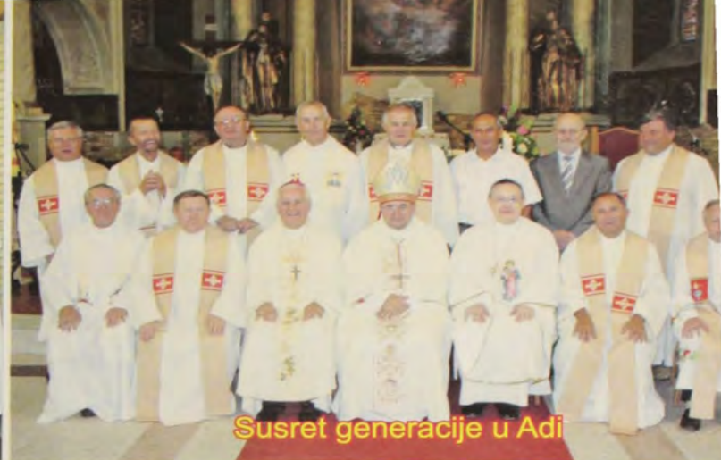
Susret generacije u Adi