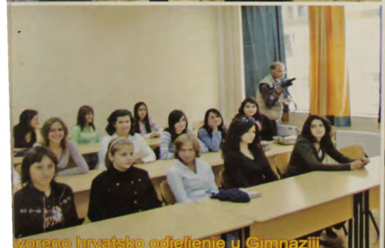
tvoreno hrvatsko odeljenje u Gimnaziji