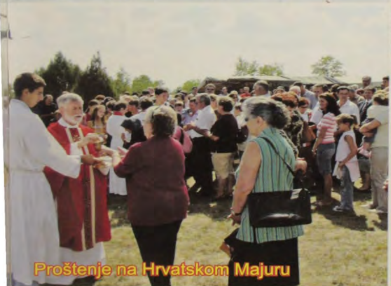
Proštenje na Hrvatskom Majuru