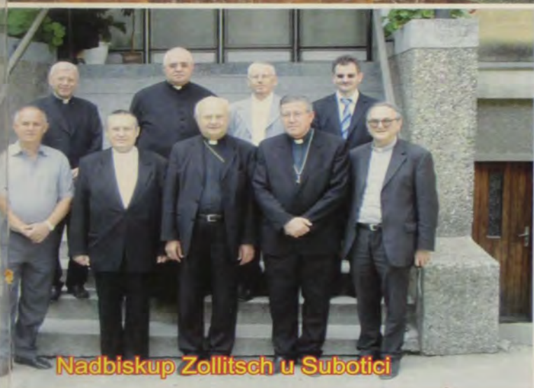
Nadbiskup Zollitsch u Subotici