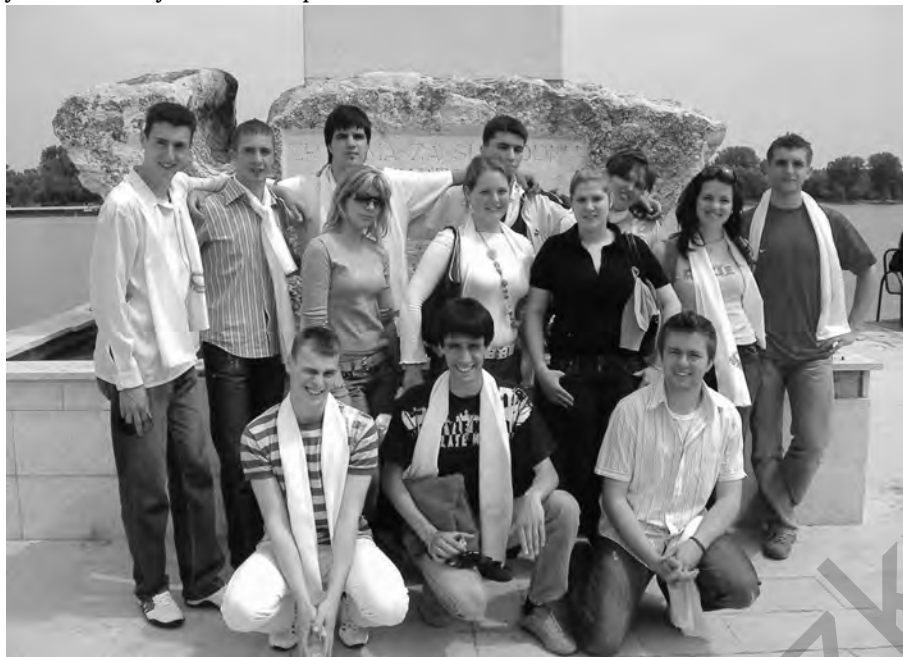
VIS "Proroci" u Vukovaru