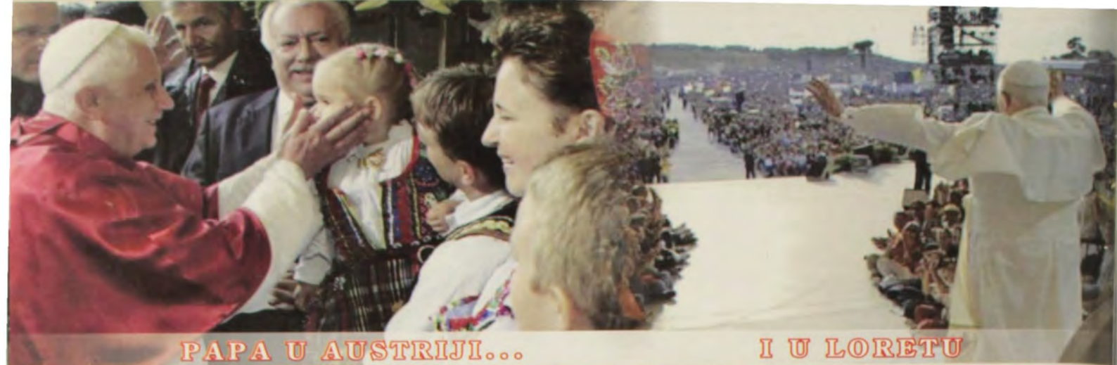
PAPA U AUSTRIJI...