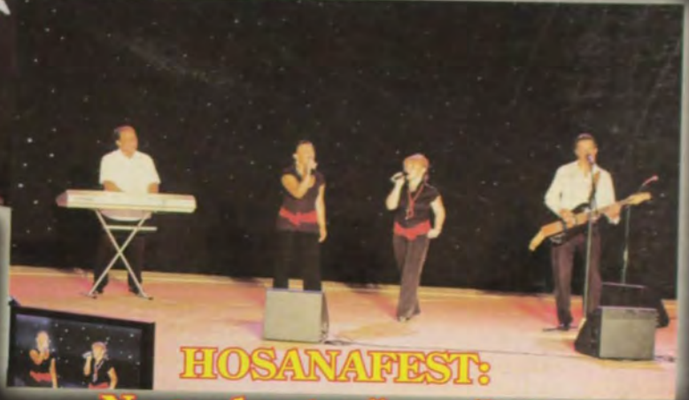
HOSANAFEST: Nagrada stručnog žirija