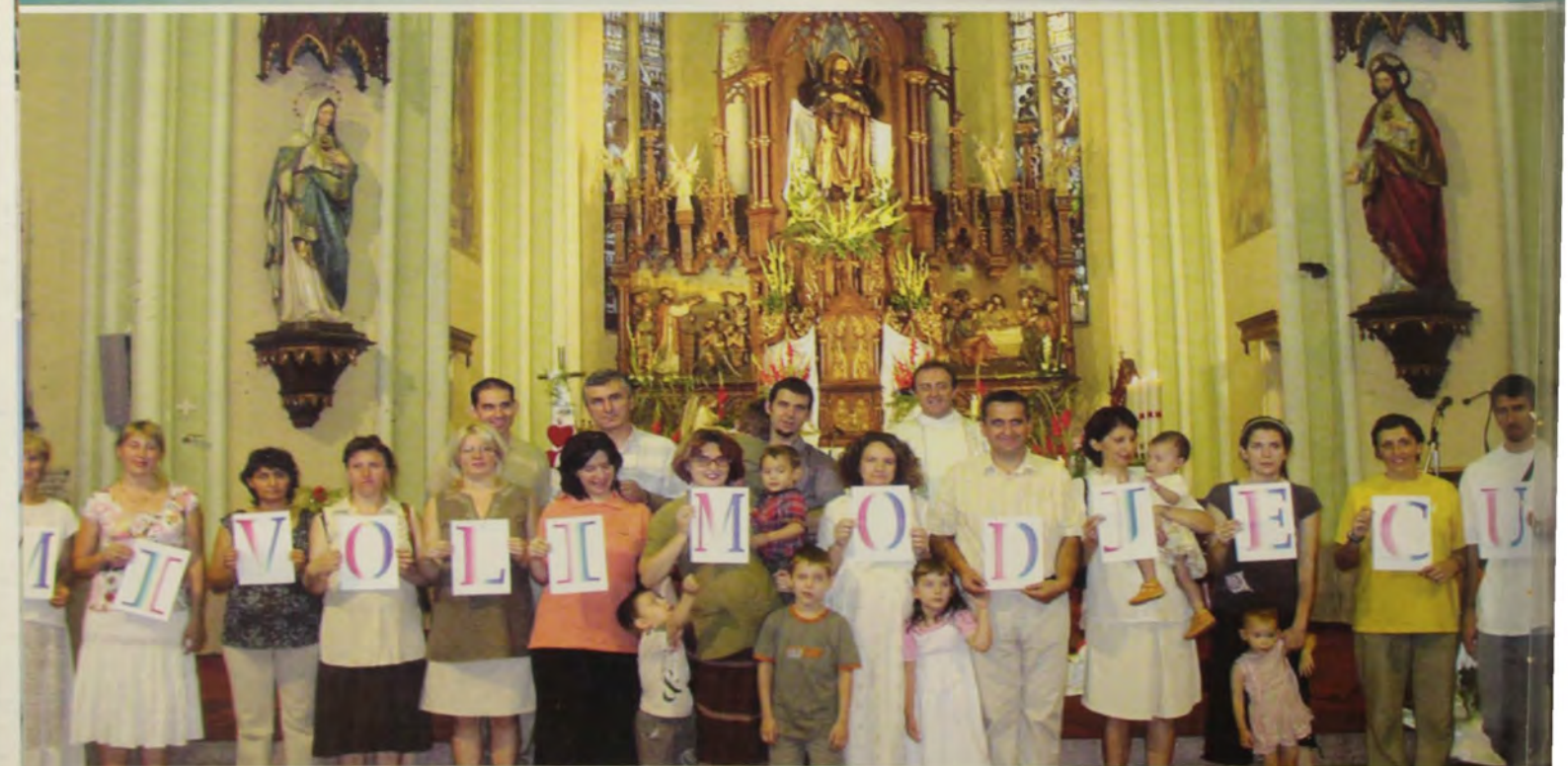
BLAGOSLOV TRIDNICA II ŽUPI SV. ROKA