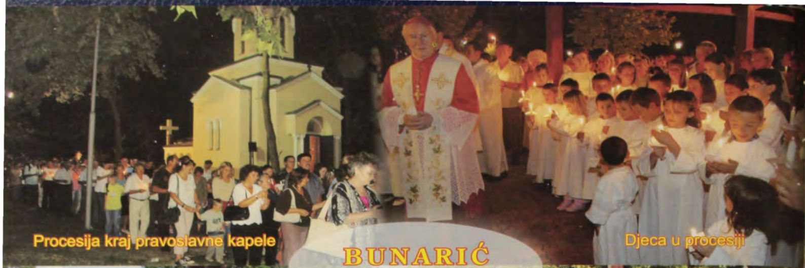
Procesija kraj pravoslavne kapele