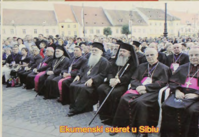
Ekumenski susret u Sibiu