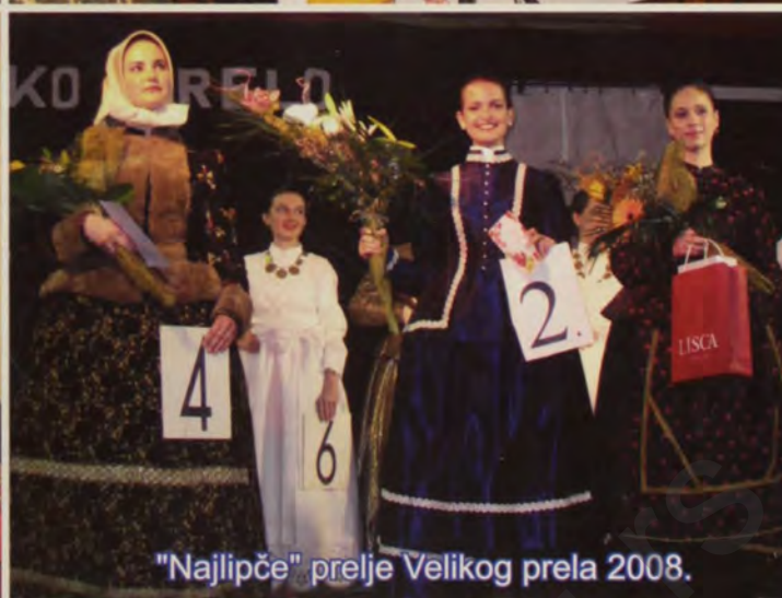
"Najlipče" prelje Velikog prela 2008.