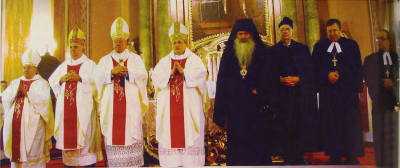
40. obljetnica Biskupije i završetak Molitvene osmine