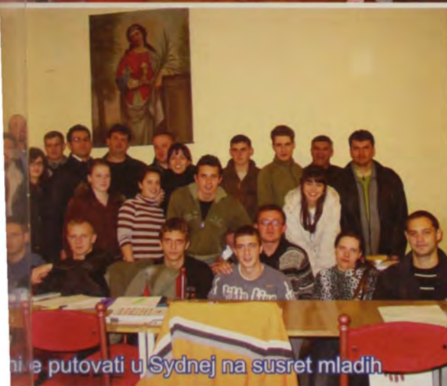
ne putovati u Sydnej na susret mladih