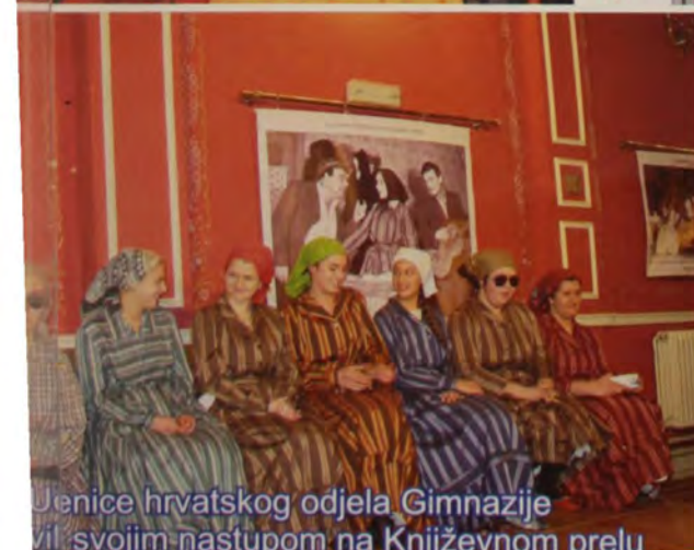
Uenice hrvatskog odjela Gimnazije svil svojim nastupom na Književnom prelu