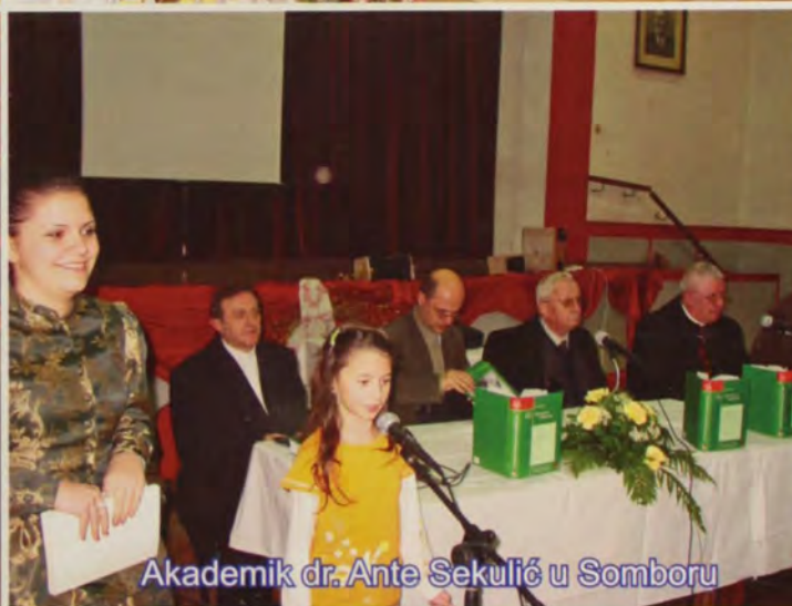
Akademik dr. Ante Sekulić u Somboru