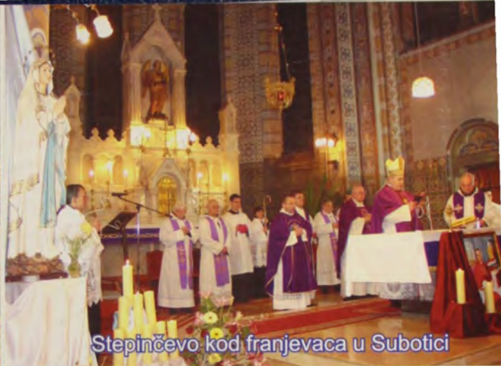
Stepinčevo kod franjevaca u Subotici