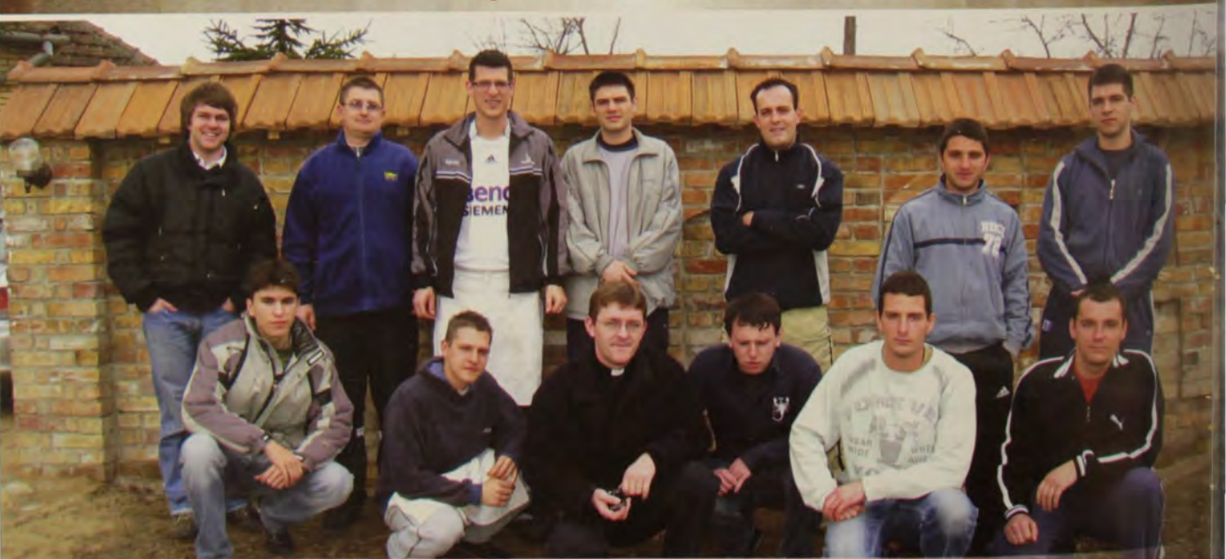
"Zvonik" u zajednici "Hosana"