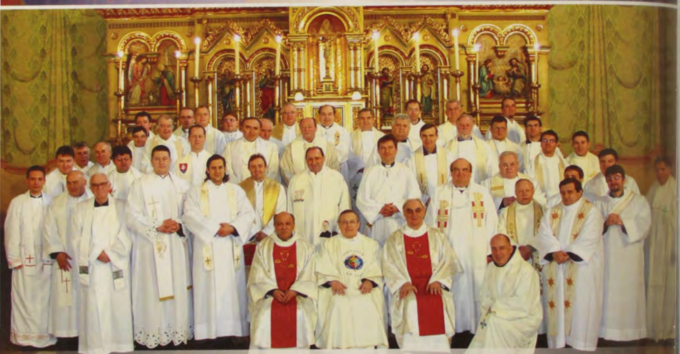
Svećenici na duhovnoj obnovi kod karmelićana u Somboru