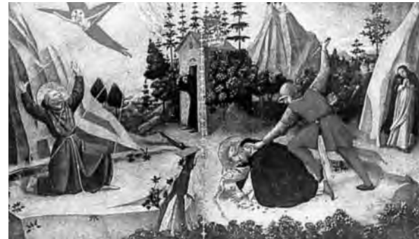
Stigmatizacija sv. Franje Asiškoga i smrt sv. Petra mučenika

Fra Angelicovu sliku Stigmatizacija sv. Franje Asiškoga i smrt sv. Petra mučenika otkupio je biskup Strossmayer u Firenzi 1873. godine od Filipa Angelia za 6.600 franaka. Slika prikazuje osnivača franjevačkoga Reda, svetog Franju u najveličanstvenijem trenutku njegova ovozemaljskoga života – kada prima stigme (rane Raspetoga) po uzoru na Isusa Krista. Slika prikazuje i najvećega dominikanskoga mučenika, svetoga Petra iz Verone, u trenutku kada ga njegov imenjaka, Petar da Balsano, zvani Carino, po nalogu heretika ubija