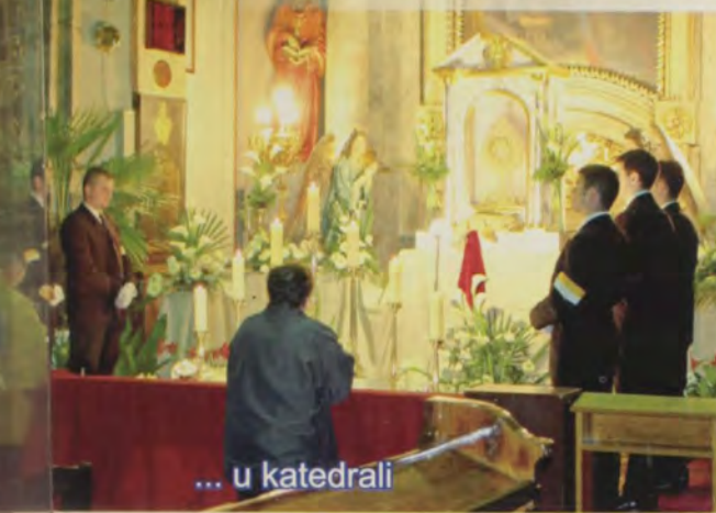
... u katedrali