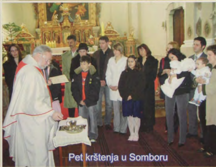
Pet krštenja u Somboru