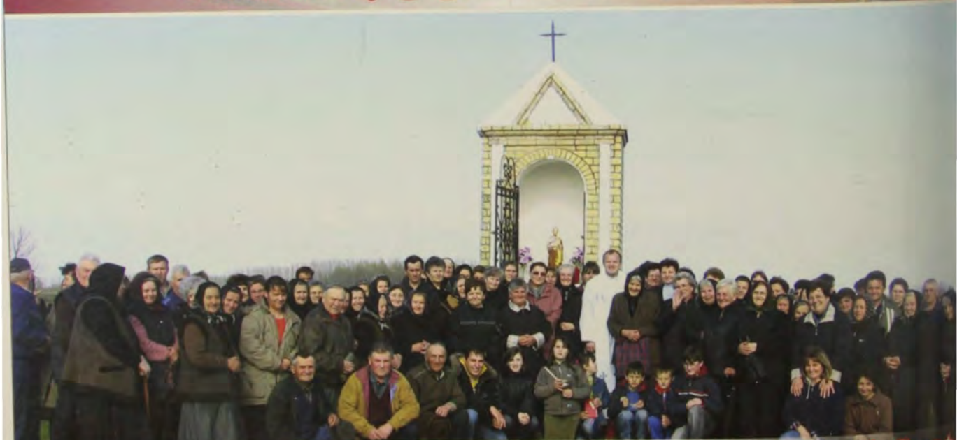
Blagoslovljena obnovljena kapela Sv. Josipa kod Sont