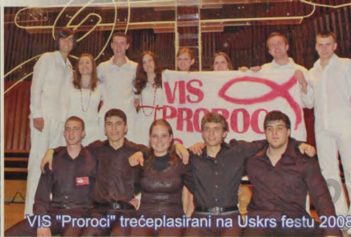
"VIS "Proroci" trećeplasirani na Uskrs festu 2008.