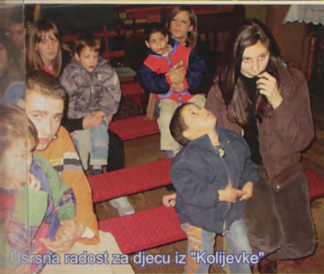
Usrsna radost za djecu iz "Kolijevke"