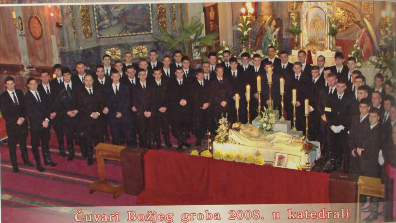
Ćuvvari BoŹjeg groba 2008. u katedrali