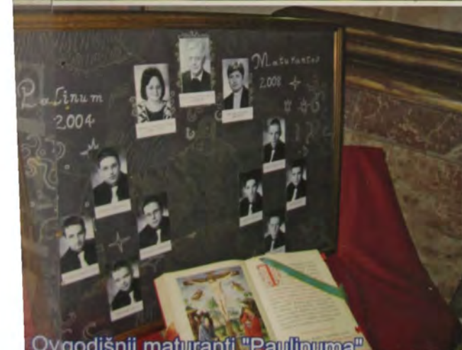
Ovogaodišnji maturanti "Paulinuma"