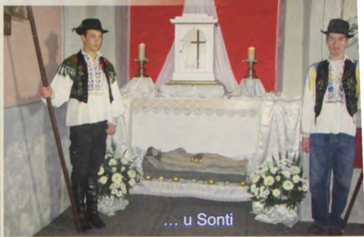
... u Sonti