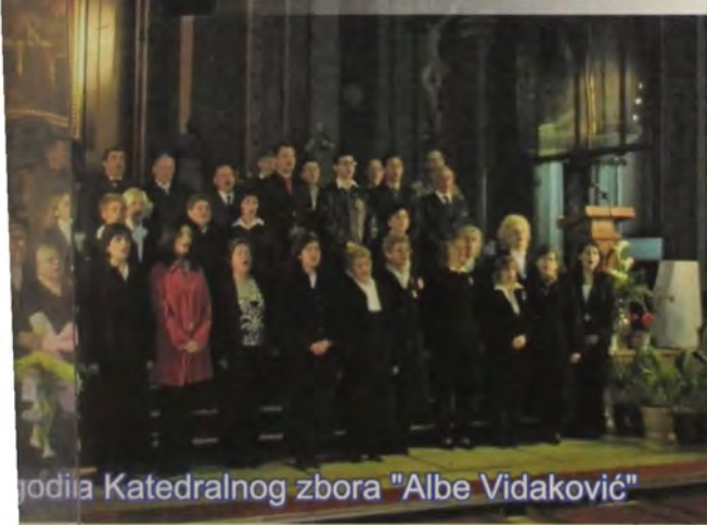
godina Katedralnog zbora "Albe Vidaković"