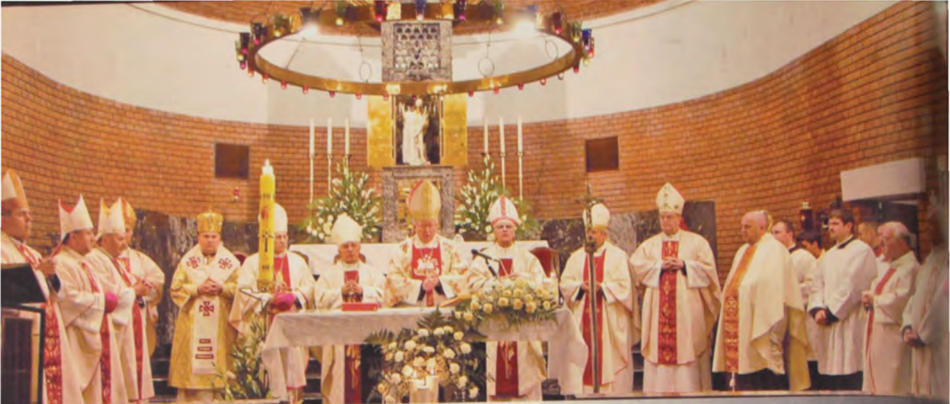
Biskupi MBK sv. Ćirila i Metoda u Beogradu