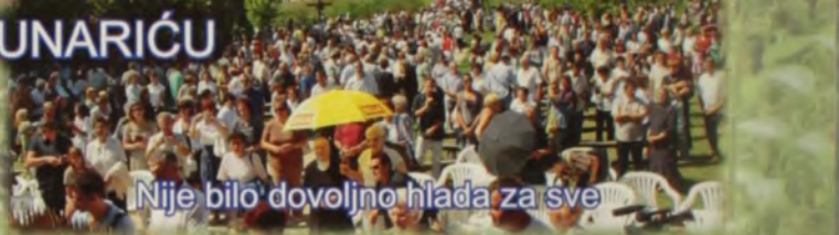
Nije bilo dovoljno hladna za sve