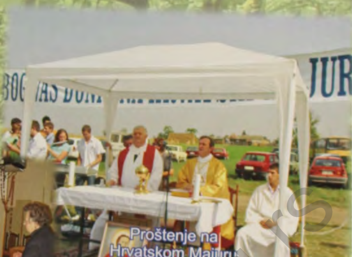
Proštenje na Hrvatskom Majuru