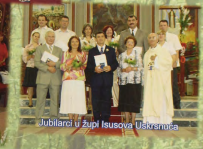
Jubilarci u župi Isusova Uskrsnuća