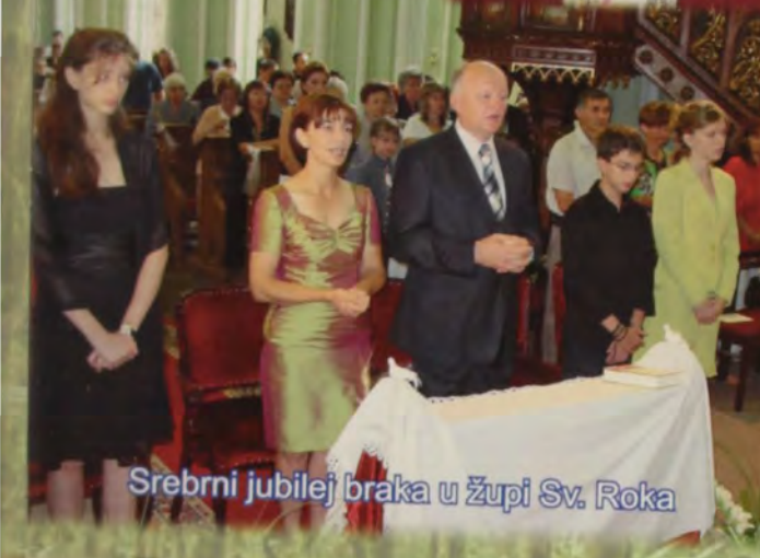
Srebrni jubilej braka u župi Sv. Roka