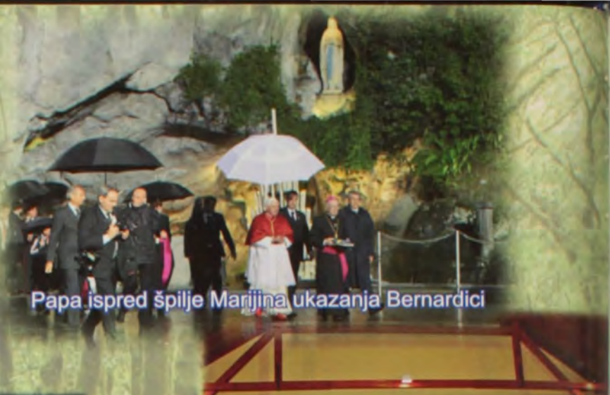
Papa ispred špilje Marijina ukazanja Bernardici