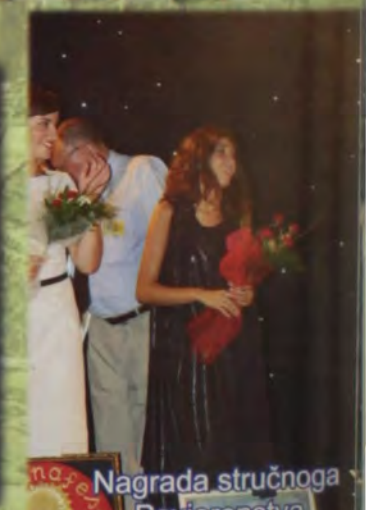
Nagrada stručnoga Povjerenstva