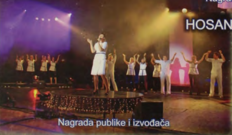
Nagrada publike i izvođača