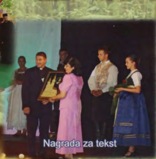
Nagrada za tekst