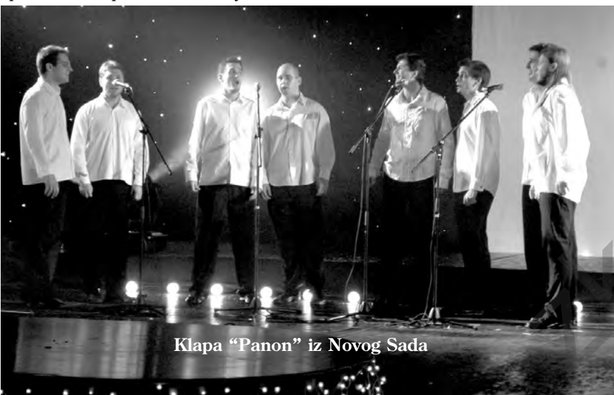
Klapa "Panon" iz Novog Sada