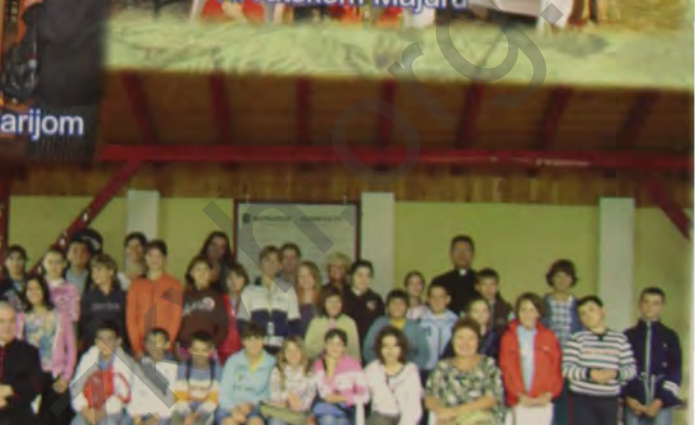
Učenici OŠ "Ivan Milutinović" na Bunariću