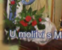
U molitvi s Marijom