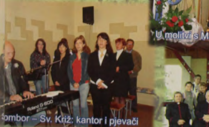
Škomoš – Sv. Križ: kantor i pjevači