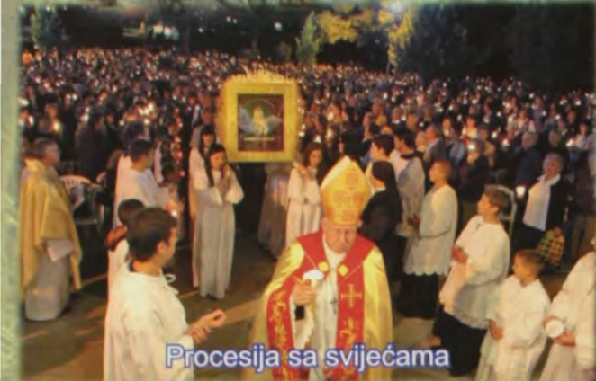
Procesija sa svijećama