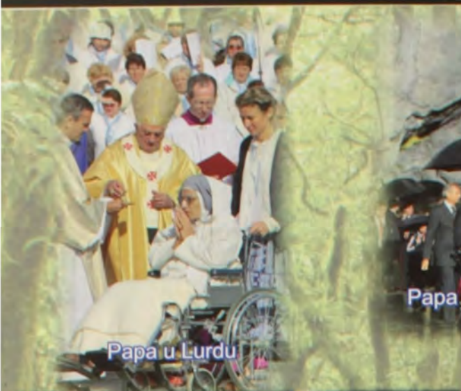
Papa u Lurdu