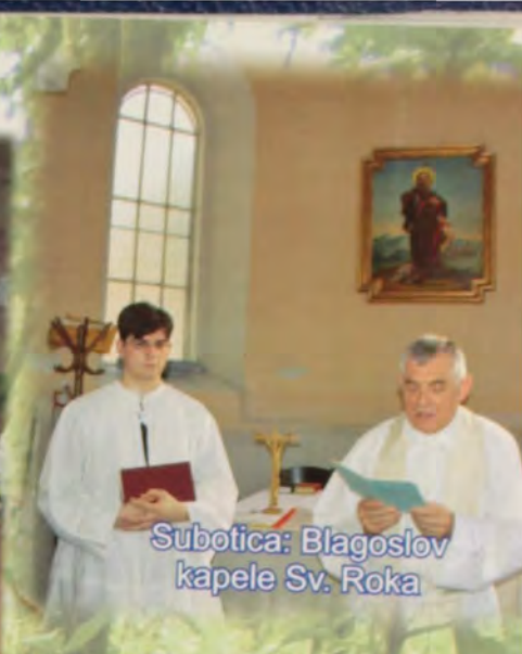
Šibotica: Blagoslov kapele Sv. Roka