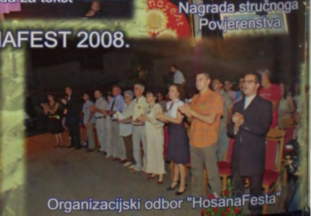
Organizacijski odbor "HosanaFesta"