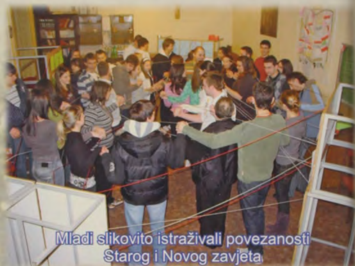
Mladi slikovito istraživali povezanosti Starog i Novog zavjeta