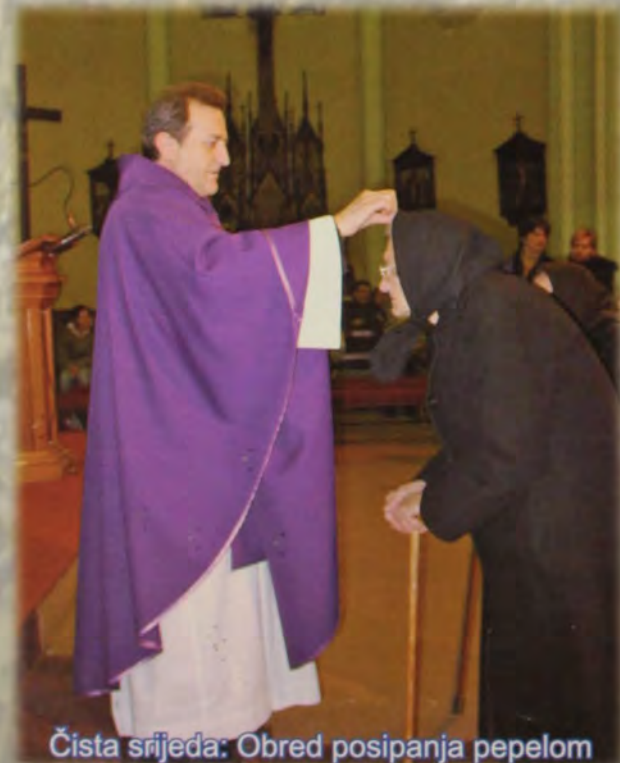
Čista srijeda: Obred posipanja pepelom