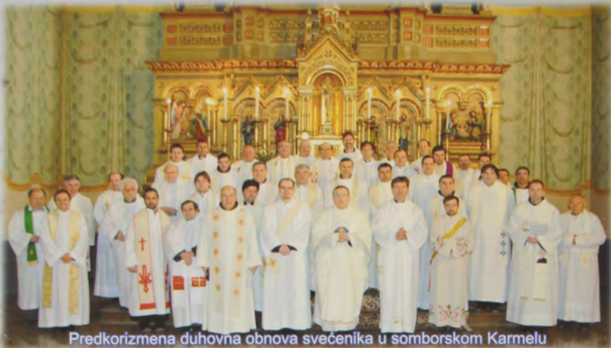
Predkorizmena duhovna obnova svećenika u somborskom Karmelu