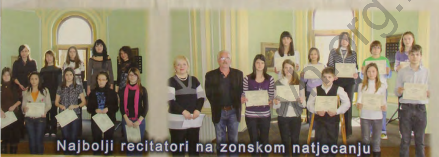
Najbolji recitatori na zonskom natjecanju