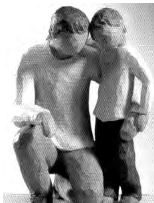
/Bruno Ferrero "Priče iz pustinje"/

Otac je promatrao svog sinčića kako pokušava premjestiti oveću vazru sa cvijećem. Mališan se trudio, naprezao, mrmljao, ali nije ju uspio ni pomaknuti.