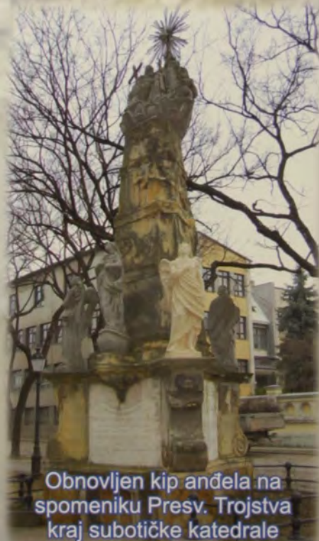
Obnovljen kip anđela na spomeniku Presv. Trojstva kraj subotičke katedrale