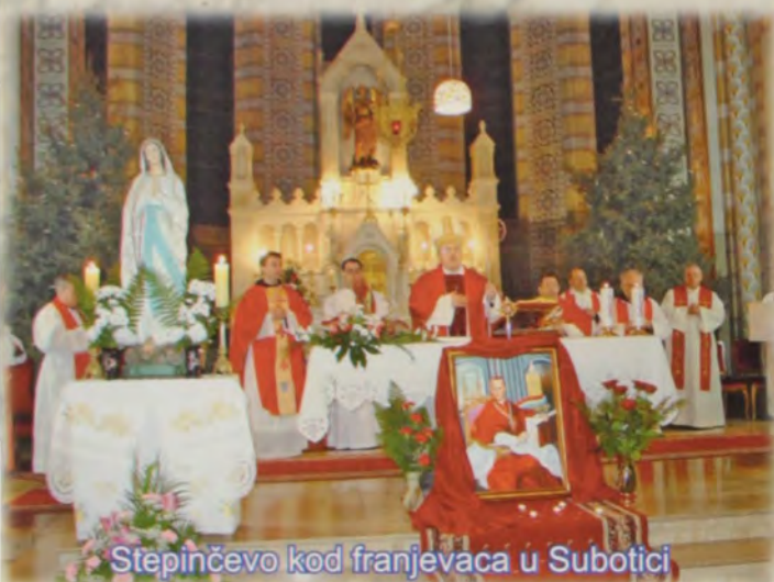
Stepinčevo kod franjevacu u Subotici