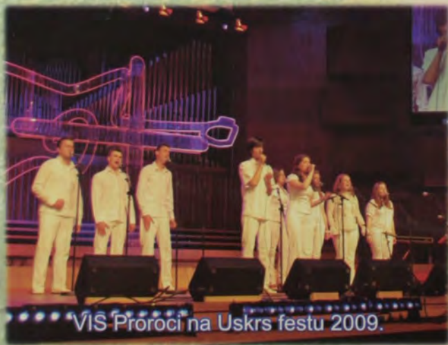
ViS Proroci na Uskrs festu 2009.