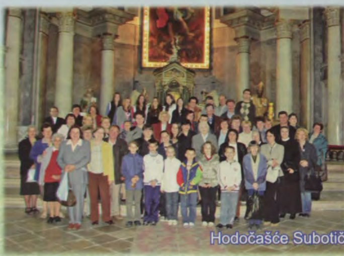
Hodočašće Subotičkog arhiepiskopata u Bač