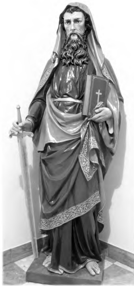
Kip sv. Pavla, Bač

prelazi na nabranje patnja koje su ga zadesile u njegovu apostolskom djelovanju. Upravo te patnje, zbog kojih njegovi protivnici stavljaju u pitanje njegov apostolski identitet, potvrđuje njegovu potpunu pripadnost Kristu. Jer svaki apostol to blago ima u glinenoj posudi da izvanredna ona snaga bude očito Božja, a ne od njega (usp. 4,7). Pavao se dakle hvali svojim slabostima, jer upravo one – kako on to sam tvrdi – potvrđuju njegovo potpuno zajedništvo s Kristom: uvijek umiranje Isusovo u tijelu pronosimo da se i život Isusov u tijelu našem očituje (4,10).