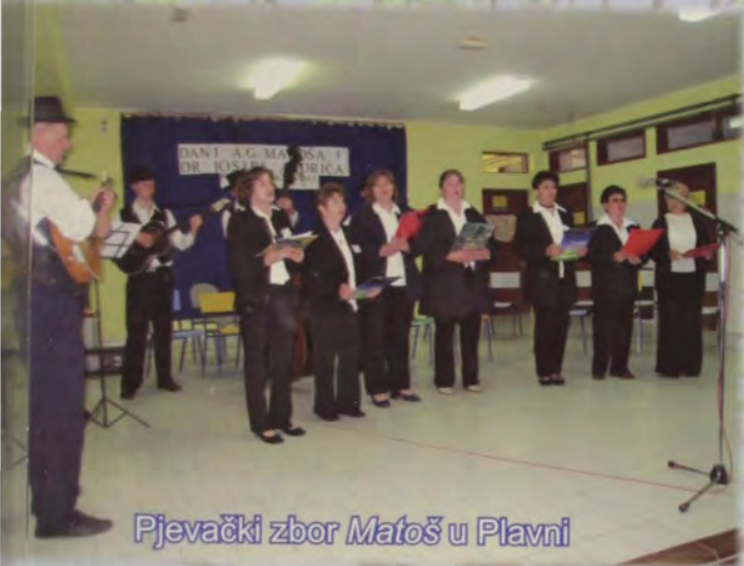
Pjevački zbor Matoš u Plavni