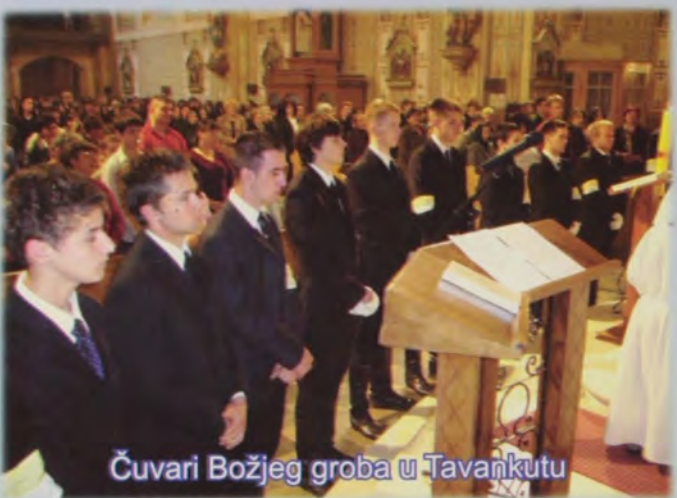
Čuvari Božjeg groba u Tavaňkutu