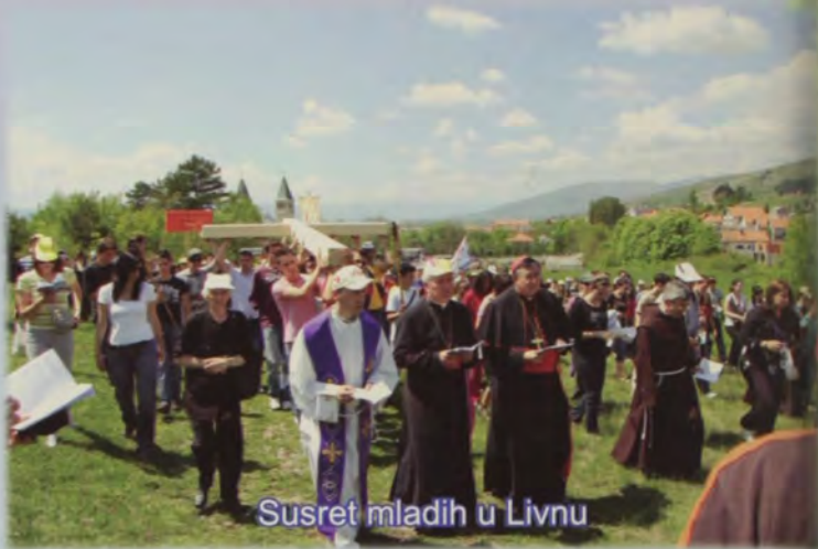
Susret mladih u Livnu