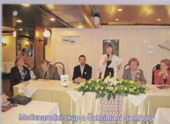
Međunarodni skup o Šokcima u Somboru