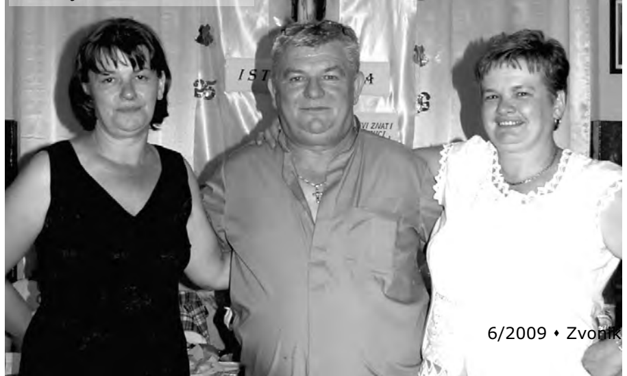
Slavljenik sa sestrama

□ Velika je radost biti u ovakvoj župi za onoga tko se zna prilagoditi. Na koncu, čovjek ovdje nije samo na jedno usmjeren, nego upravo zato što ima više konfesija, potrebno je biti otvoren prema svima. Sa svima je moguće pametno i lijepo razgovarati o Bogu, a naravno i o ljudskim problemima, o onome što ispunja ljude koji me okružuju. Zato su vrata župe uvijek otvorena, za sve koji su potrebni pomoći. Ono što je u danom trenutku moguće, bit će im pruženo. Ovdje prije svega mislim na utješne riječi svećenika, riječi Evanđelja. Sva ta različitost mene vrlo ispunja. Upravo ta stalna otvorenost prema drugima, kako bih mogao razumjeti kako dotična osoba što doživljava, osjeća,