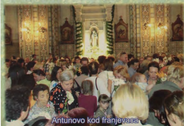
Antunovo kod franjevaca