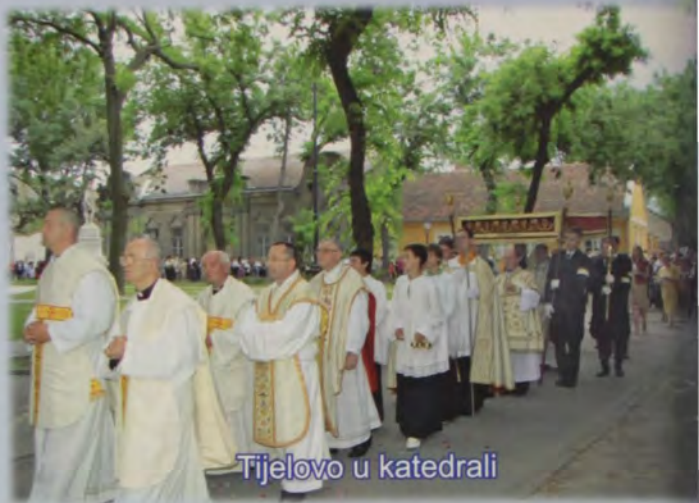
Tijelovo u katedrali