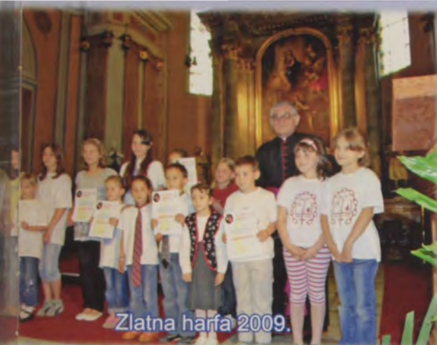
Zlatna harfa 2009.