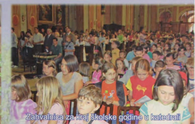
Zahvalnica za kraj školske godine u katedrali