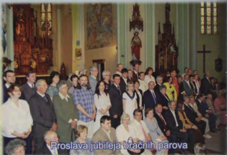
Proslava jubileja bračnih parova