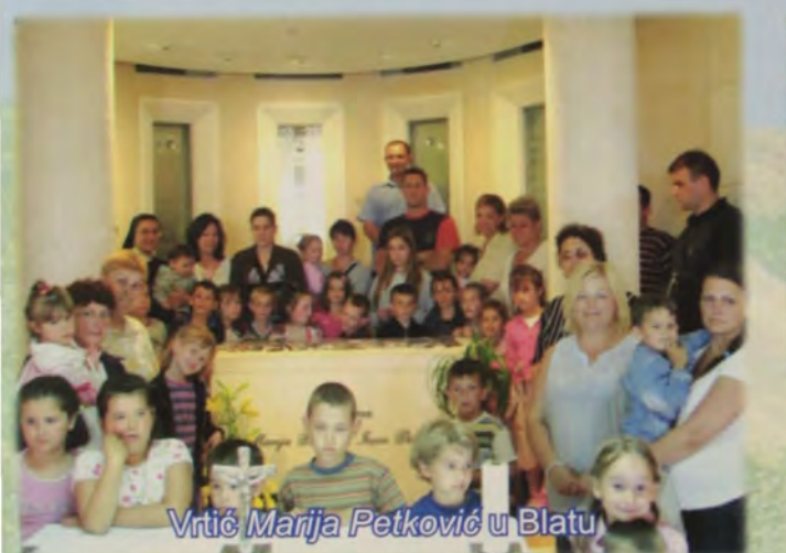
Vrtić Marija Petković u Blatu