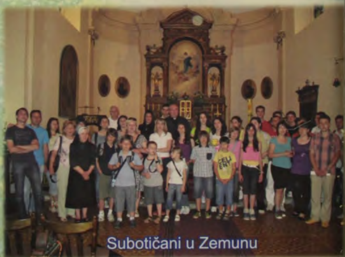
Subotičani u Zemunu