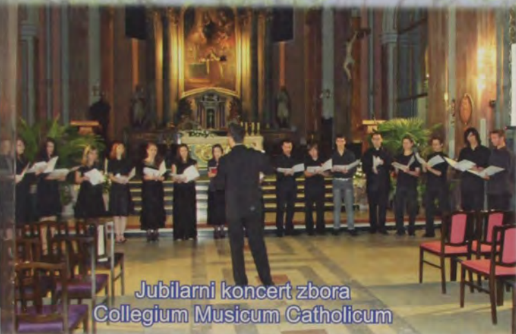
Jubilarni koncert zbora Collegium Musicum Catholicum