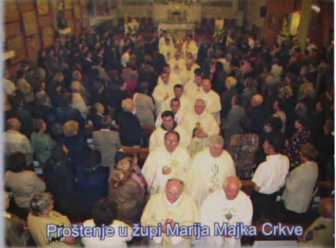
Proštenje u župi Marija Majka Crkve