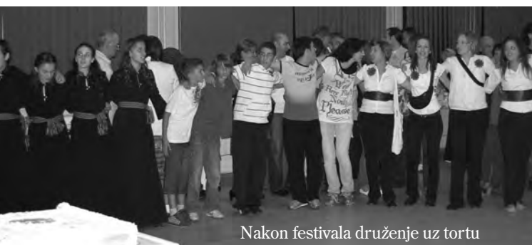
Nakon festivala druženje uz tortu

– Vrlo me je ugodno iznenadila Vojvodina i Subotica i ljudi koji ovdje žive. U Zagrebu će drugi čuti samo najbolje o Subotici i Vojvodini – dodao je Antonio.