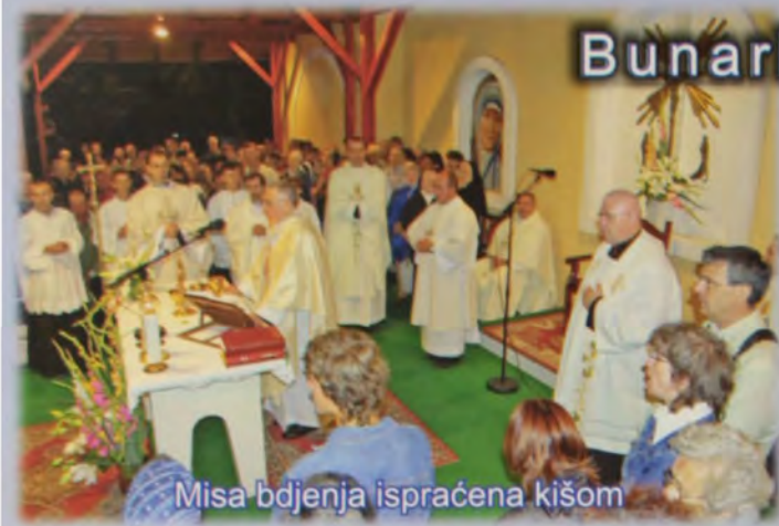
Misa bdjenja ispraćena kišom