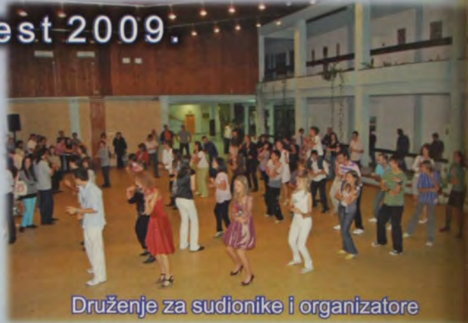
Druženje za sudionike i organizatore