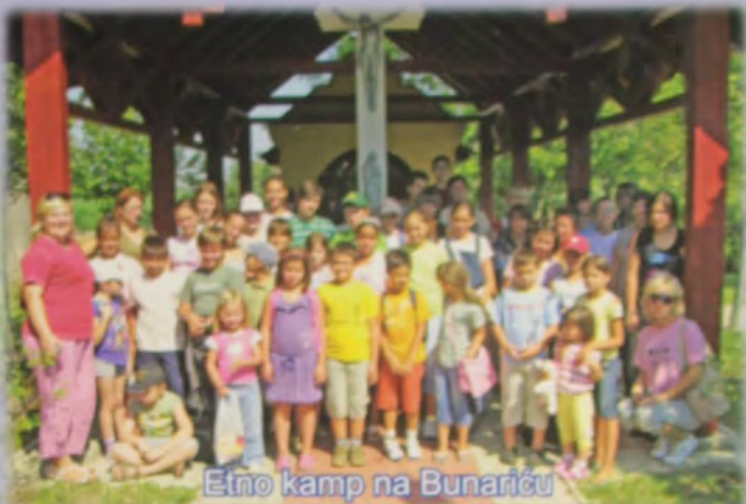
Etno kamp na Bunariću