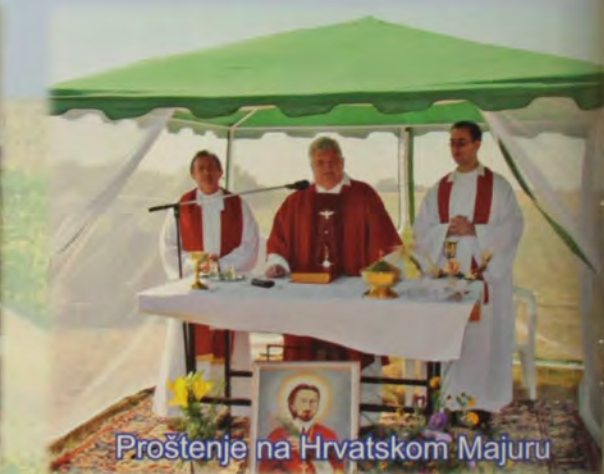
Proštenje na Hrvatskom Majuru