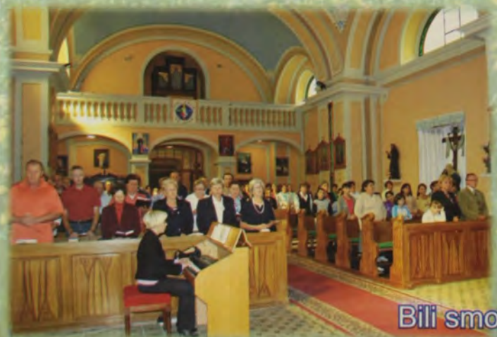
Bili smo u Vajskoj