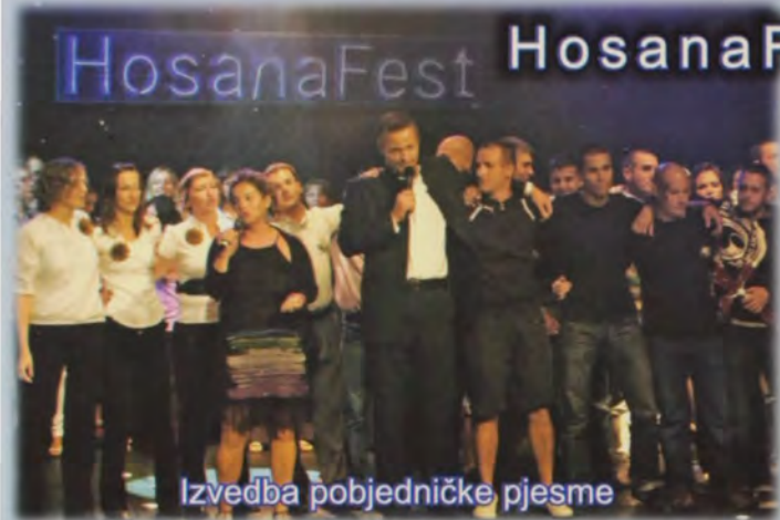
Izvedba pobjedničke pjesme