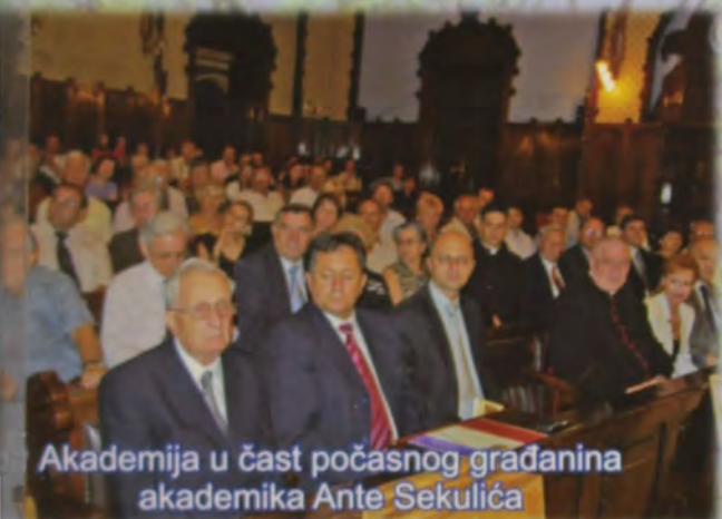
Akademija u čast počasnog građanina akademika Ante Sekulića