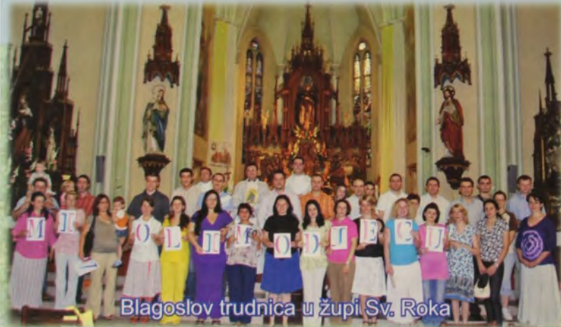
Blagoslov trudnica u župi Sv. Roka