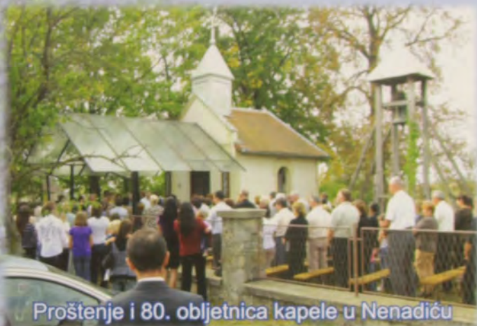
Proštenje i 80. obljetnica kapele u Nenadiću

Umjetnost življenja slična je umijeću bojenja!