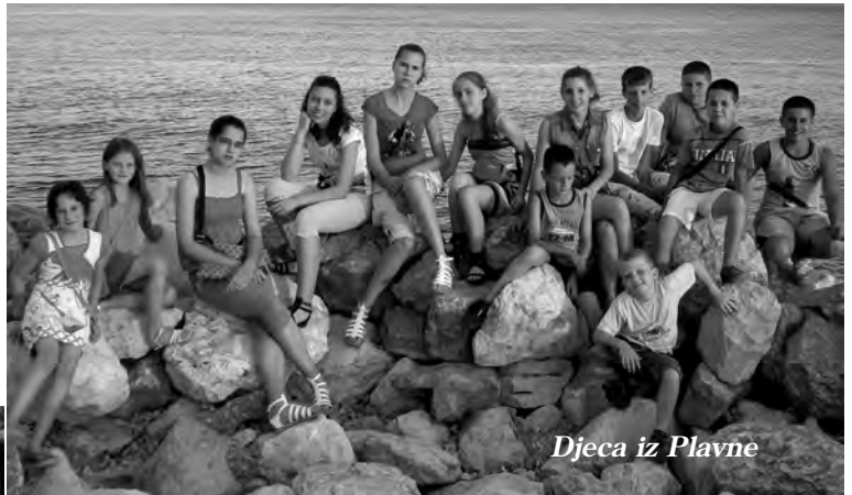
Djeca iz Plavne

na njima to je vaše sudjelovanje u onim programima u kojima ste blizu Isusa. A kada ste s njim, onda i odmor ima drukčiju sliku. Znali ste reći BOŽE, HVALA TI! I to onako iz srca. Zato ovdje gledate i čitate priču o vama kroz nekoliko događaja kroz koje se vidi i vaša zahvalnost i vaša radost, ali i ono što ste lijepo uradili i kada ste bili za svoj trud pohvaljeni i nagrađeni. A do sljedećeg Zvonika u Subotici će biti etno kamp o čemu ćete sigurno čitati u idućem broju. Iskoristite ovo ljeto i za koju lijepu riječ u knjizi, radujte se suncu i ljepoti prijateljstva!