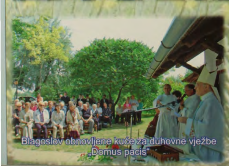
Blagoslov obnovljene kuće za duhovne vježbe „Domus pacis“