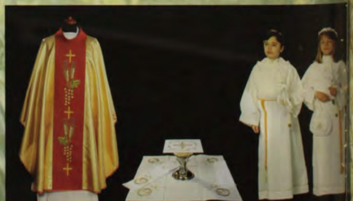
Liturgijska ruha, oprema i pribor. Sve na jednom mjestu. Tel.: 024/755-002, Mobitel: 064/130-73-93