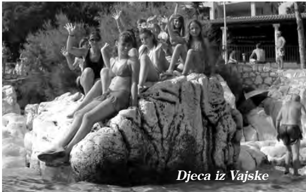
Djeca iz Vajske

Ljeto djeca vole. A kako i ne bi? Sunce svakoga mami u vodu, nekoga u more a druge u bazene ili na salaše kod rođaka. Djeca su tada slobodna jer mogu trčati, kupati se i biti skroz radosna. A da ste i vi, dragi Zvončići, imali bogato ljeto i puno programa potvrđuju i ove vaše stranice. Ipak, ono što je vidljivo