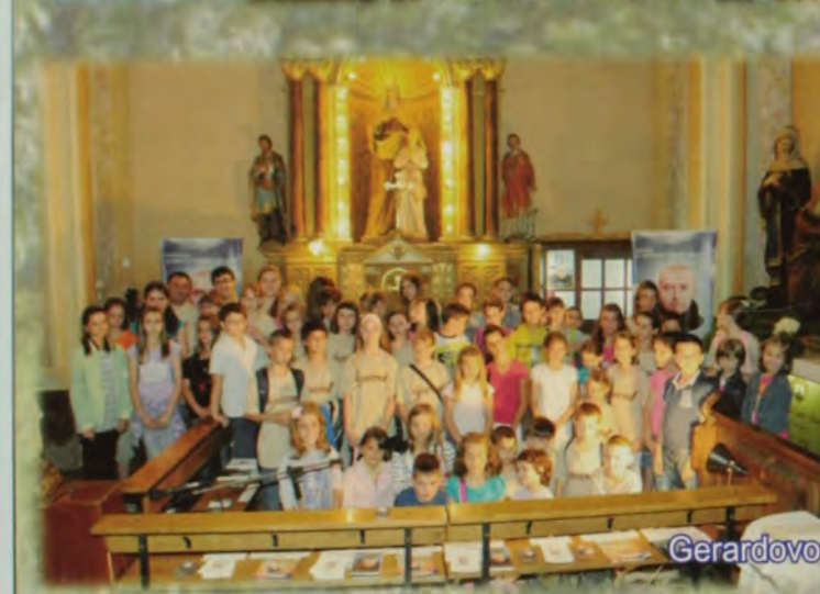
Gerardovo u Somboru