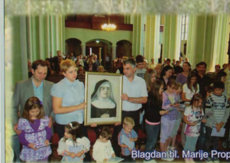
Blagdan bl. Marije Propetog Petković u Subotici