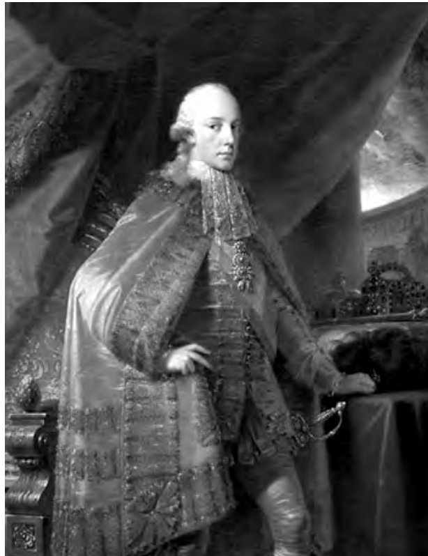
* 12. veljače 1768. u Firenci, † 2. ožujka 1835. u Beču. Bio je posljednji car Svetoga rimskog carstva.

Za Wagnerova župnikovanja pojavila se jedna čudna sljedba u okolnim selima, ali su se njezini sljedbenici našli i u Somboru. U predvečerje Velike Gospe, 14. kolovoza 1819. godine u 18 sati došla je procesija žena, djevojaka i nešto malo muževa. Bilo ih je do dvije tisuće. Na čelu procesije nosili su sliku svete Ane. Došli su s upaljenim svijet-