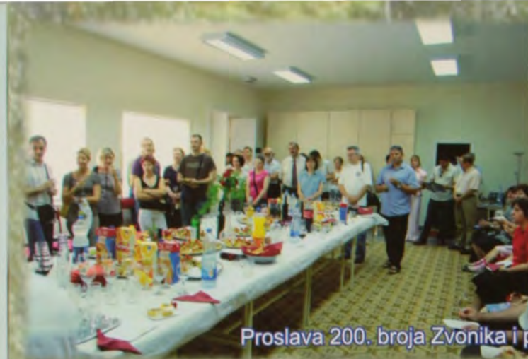
Proslava 200. broja Zvonika i primopredaja dužnosti urednika