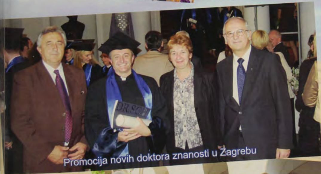
Promocija novih doktora znanosti u Zagrebu