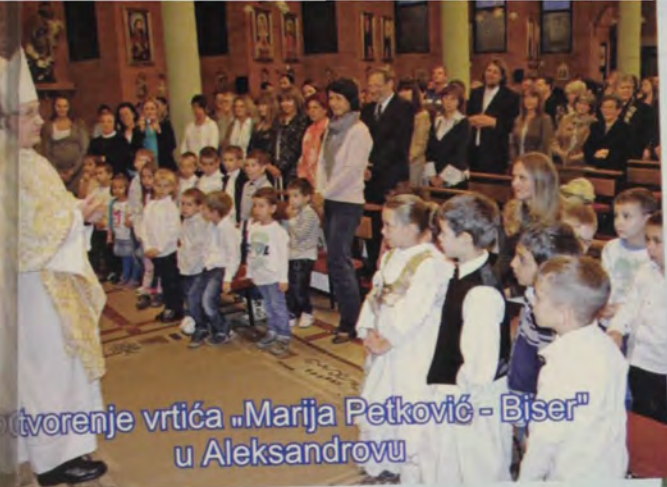
Otvorenje vrtića „Marija Petković - Biser“ u Aleksandrovu