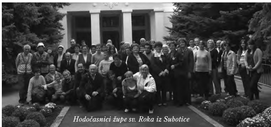
Hodočasnici župe sv. Roka iz Subotice

njegovoj pratnji te kazao da se i Katolička i Pravoslavna Crkva, koje su zapravo jedna Crkva, nalaze pred velikim izazovom. Dodao je da ih proslava Milanskog edikta poziva da se približe jedna drugoj te dadnu odgovore u vremenu u kojem žive. Naglasio je da je tu i još snažnija unutarnja potreba da budu zajedno za što ima puno razloga jer je ono što ih povezuje mnogo veće od onog što ih razdvaja. Trebamo težiti za jedinstvom Crkve jer je to želio i za to molio Onaj koji je osnovao Crkvu. Treba raditi zajedno kako bi Crkva ponudila rješenje za probleme i izlazak iz tunela u kojem živimo , rekao je patrijarh Irinej. Naglasio je da je prvi korak dijalog koji bi ponajprije morao postojati u Crkvi. Dodao je da mnogi uviđaju potrebu dijaloga kako bi vidjeli što ih dijeli te kroz diskusiju rješavali probleme. Gospodin očekuje da ispunimo želju našega Spasitelja 'da svi budu jedno' što su On i Otac jedno , zaključio je patrijarh Irinej. Uslijedio je i posjet Predsjedništvu Republike Srbije, gdje je visoko izaslanstvo predvođeno kardinalom Scolm primio predsjednik RS Tomislav Nikolić. Kardinal Scola je, kako javlja KTA, naglasio ulogu Srbije kao neospornog protagonista budućnosti Europe , kao jedinstvene raskrsnice entitete, kultura i religija.