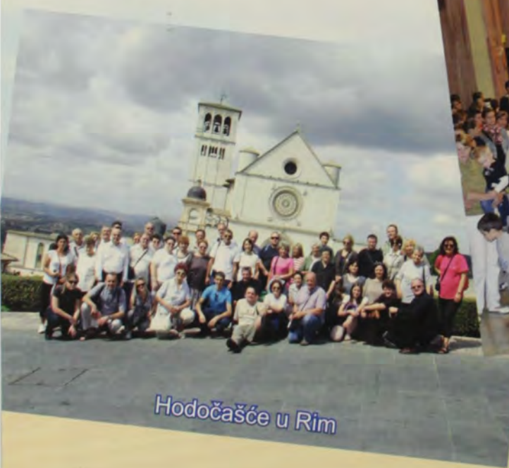
Hodočašće u Rim