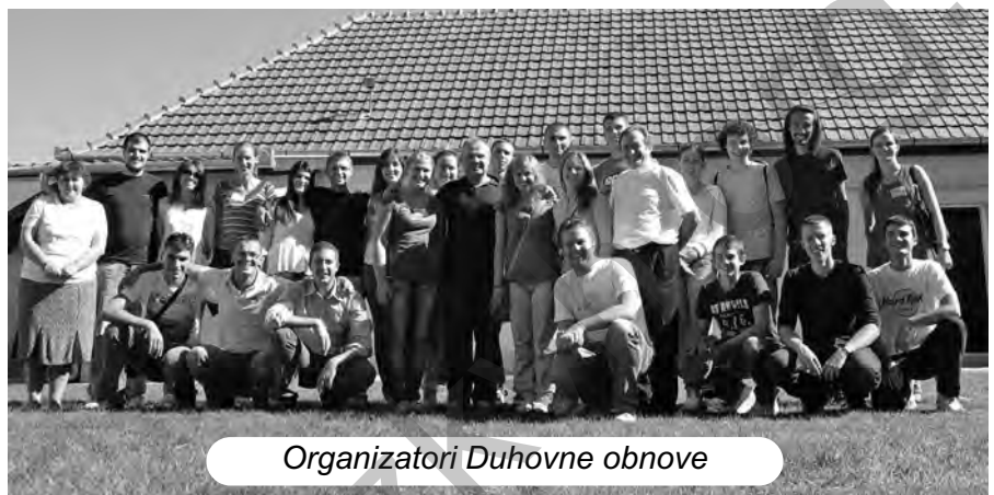
Organizatori Duhovne obnove