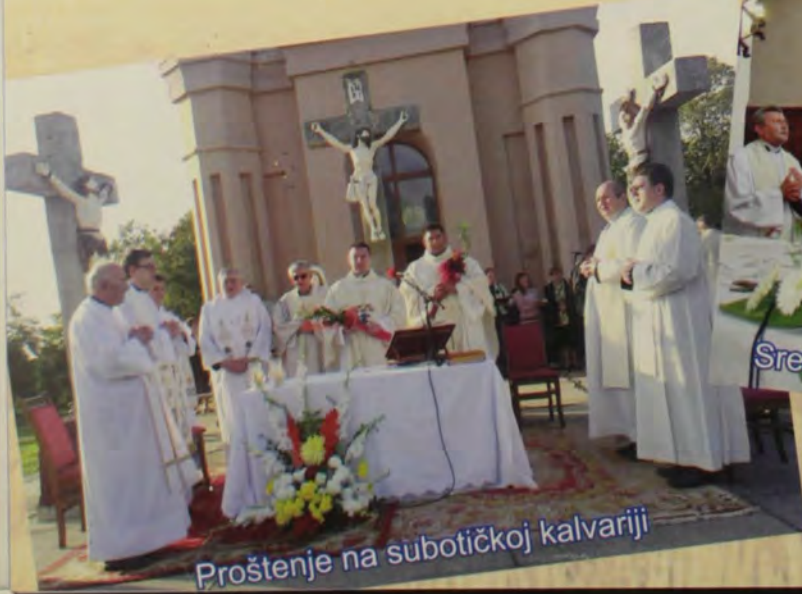
Proštenje na subotičkoj kalvariji