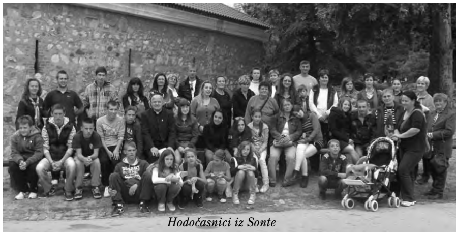
Hodočasnici iz Sonte

žiti pomirenje s Bogom od jedinstva s braćom. Vjerna vjera, svaka vjerna vjera, jer je izraz težnje za Bogom, jest izvor jedinstva među ljudima, a ne izvor sukoba ni podjela. Samo kada zagospodari ideologija, samo kada se napusti primat Boga, tada se ljudi progresivno razdvajaju. Sedamnaesta stogodišnjica tzv. „Milanskog edikta“ poručuje svima nama da je vjerska sloboda jamstvo mira i nove civilizacije u svakome pluralnome društvu. Svatko od nas dužan je osobno priznati i živjeti vrednotu slobode. Ona je nužno potrebni uvjet za sazrijevanje osobe, ali sloboda nije takva ako nije u funkciji izgradnje društva s ljudskim licem, ljudske zajednice koja treba uvijek iznova tražiti blagostanje. Ne dajmo se zavarati sirenama slobode shvaćene individualistički, nažalost veoma raširene na Zapadu, zaključio je kardinal Scola.