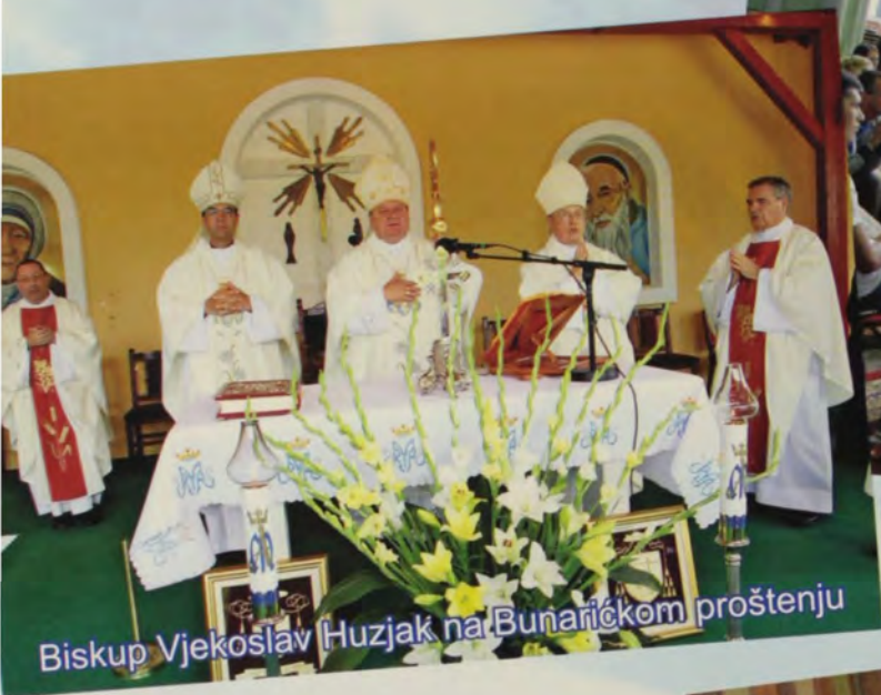
Biskup Vjekoslav Huzjak na Bunaričkom proštenju