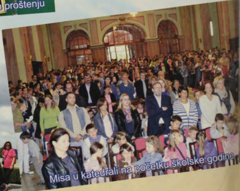
Misa u katedrali na početku školske godine