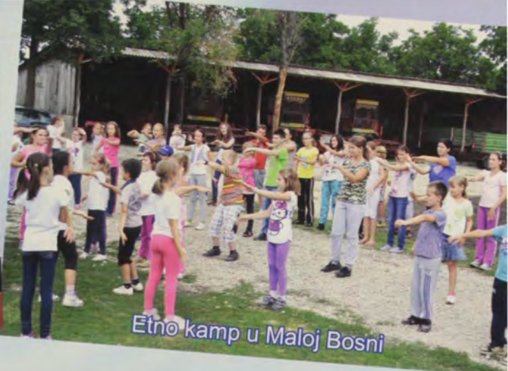
Etno kamp u Maloj Bosni