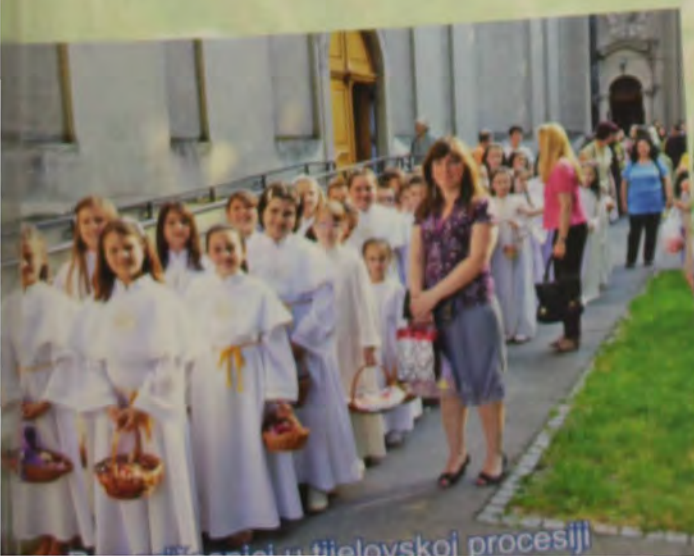
Prosesija u Tijelovskoj procesiji