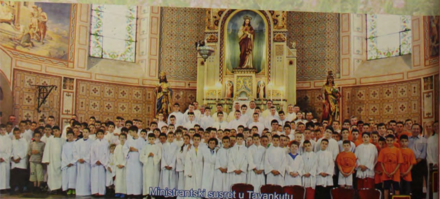
Ministrantski susret u Tavankutu