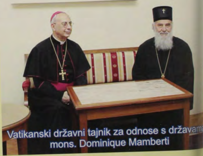
Vatikanski državni tajnik za odnose s državama mons. Dominique Mamberti