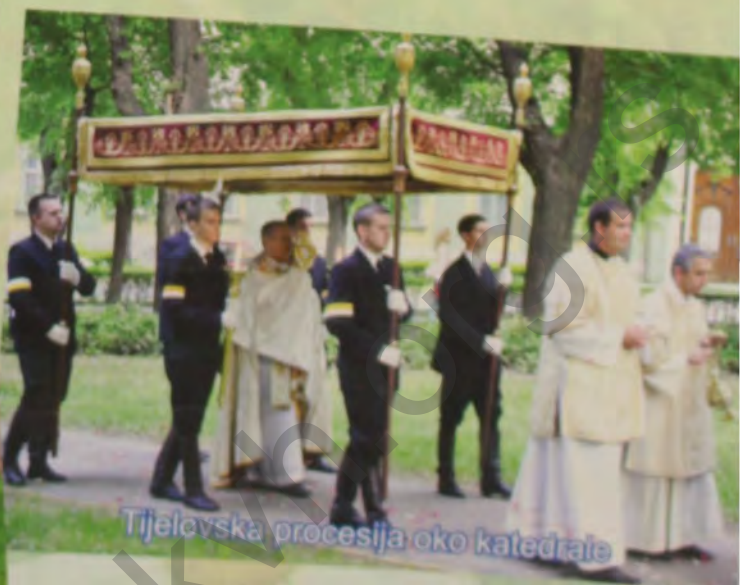
Tijelovska procesija oko katedrale