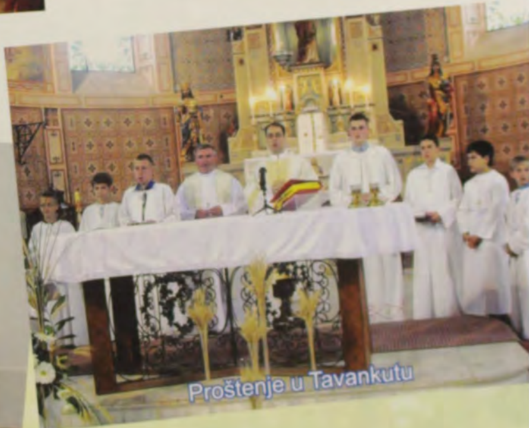
Proštenje u Tavankutu