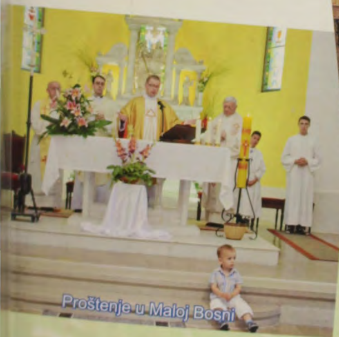
Proštenje u Maloj Bosni