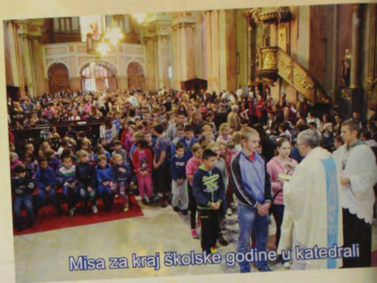
Misa za kraj školske godine u katedrali