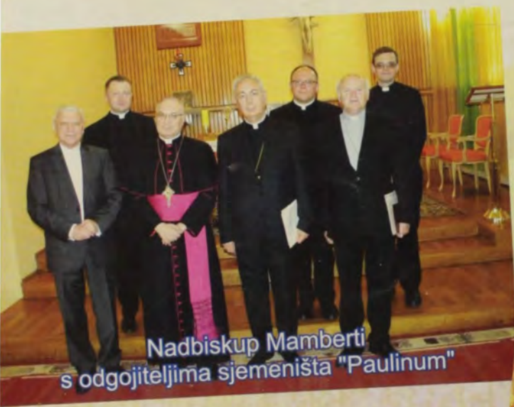
Nadbiskup Mamberti s odgojiteljima sjemeništa "Paulinum"