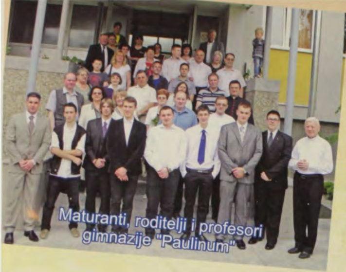
Maturanti, roditelji i profesori gimnazije "Paulinum"