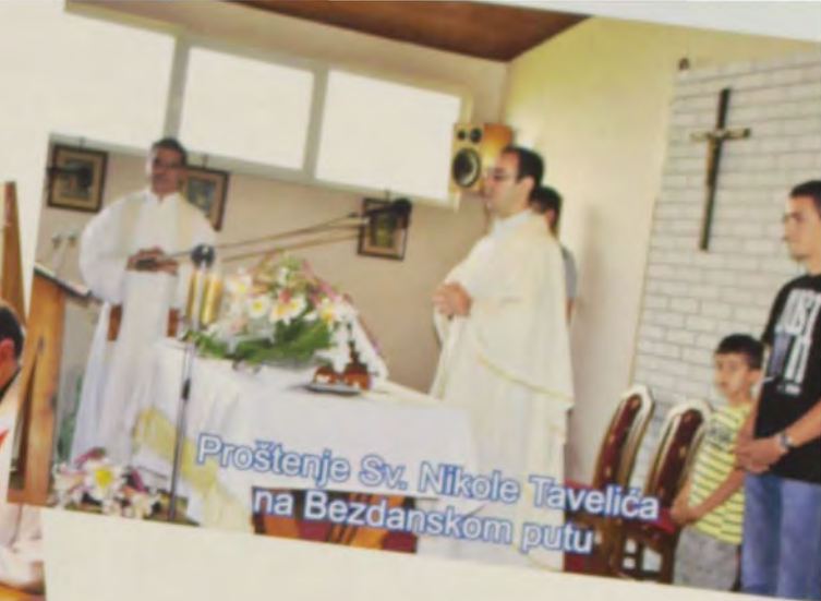
Proštenje Sv. Nikole Tavelića na Bezdanskom putu