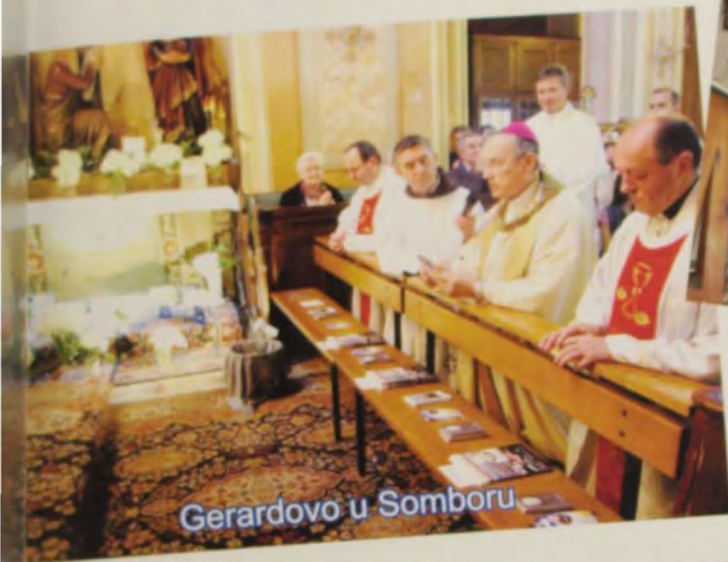
Gerardovo u Somboru