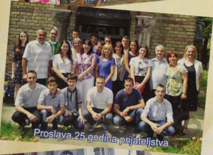
Proslava 25 godina prijateljstva