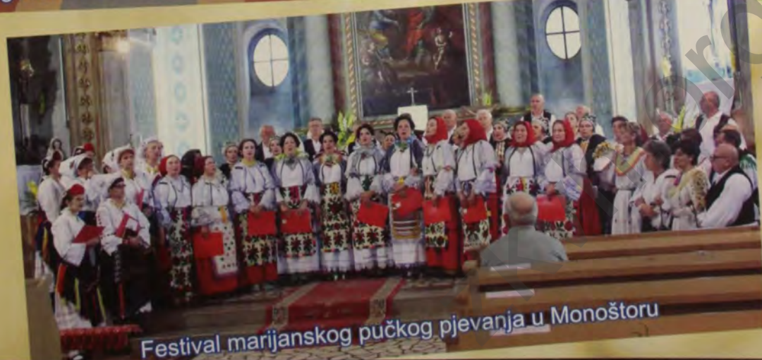
Festival marijanskog pučkog pjevanja u Monoštoru