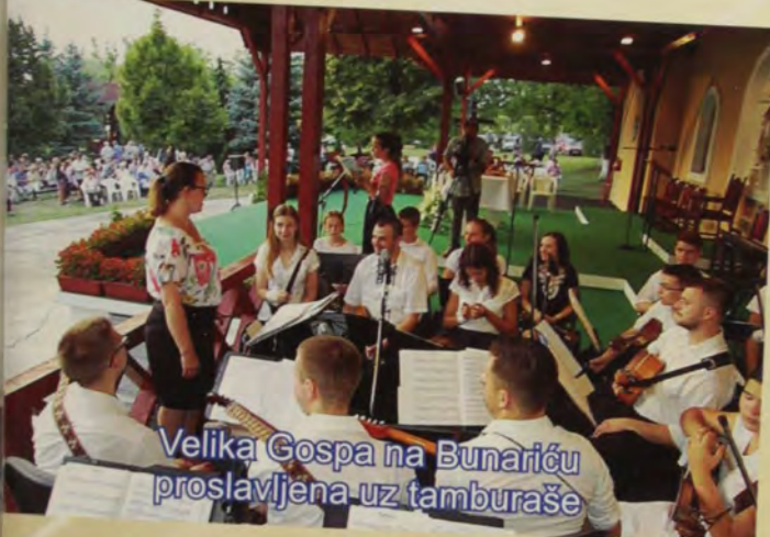
Velika Gospa na Bunariću proslavljena uz tamburaše