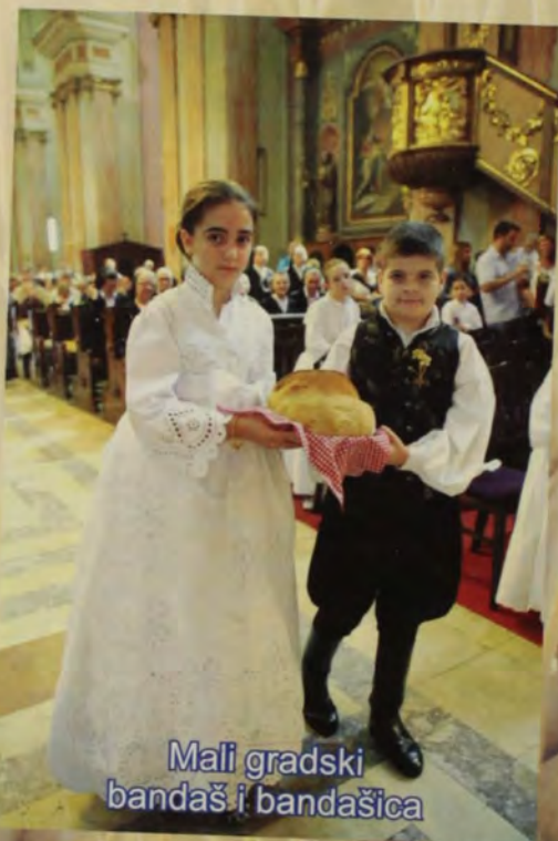
Mali gradski bandaš i bandašica