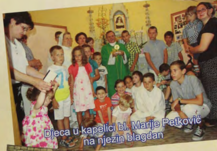
Djeca u kapelici bl. Marije Petković na njezin blagdan