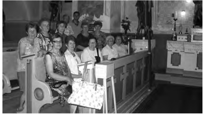
okupljeni na iznimnoj večernjoj pobožnosti javno častili odvjetnika svojih predaka.

Ove godine se prvi puta u Lemešu devet dana uoči blagdana molila krunica sv. Roka te litanije da bi na sam blagdan