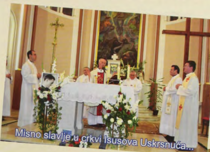
Misno slavlje u crkvi Isusova Uskrsnuća...