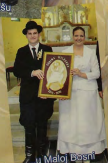
...u Maloj Bosni