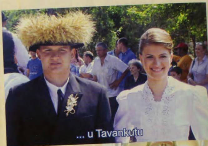
... u Tavankutu