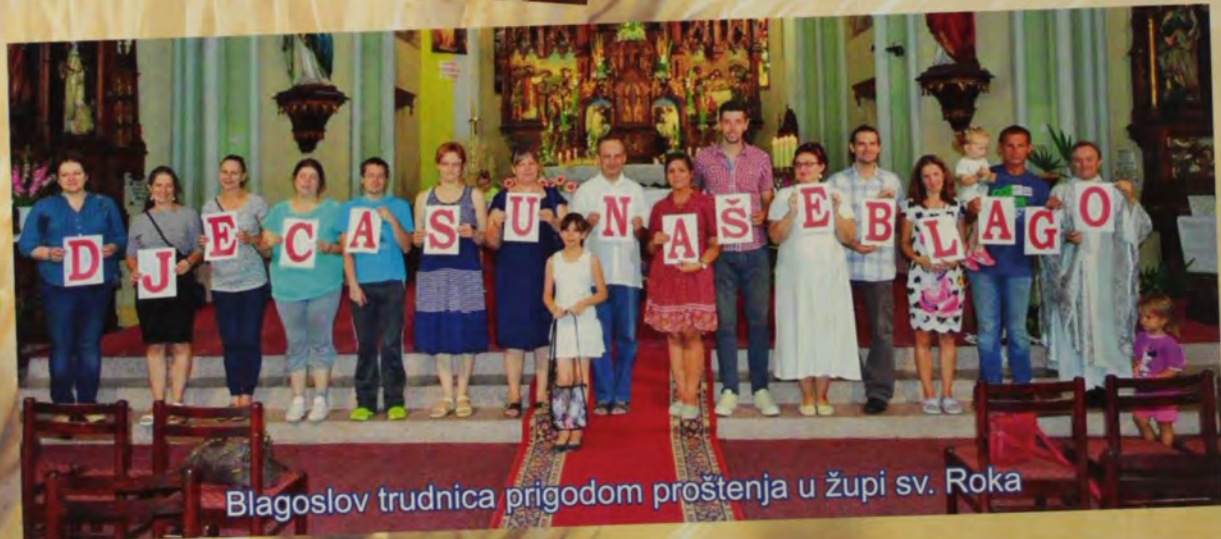
Blagoslov trudnica prigodom proštenja u župi sv. Roka