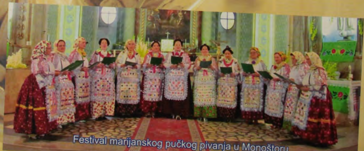
Festival marijanskog pučkog pivanja u Monoštoru