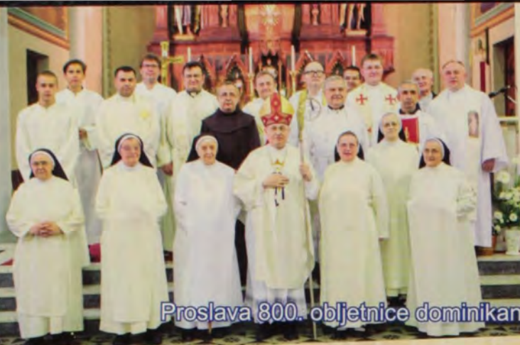
Proslava 800. obljetnice dominikanskog reda u župi sv. Jurja u Subotici