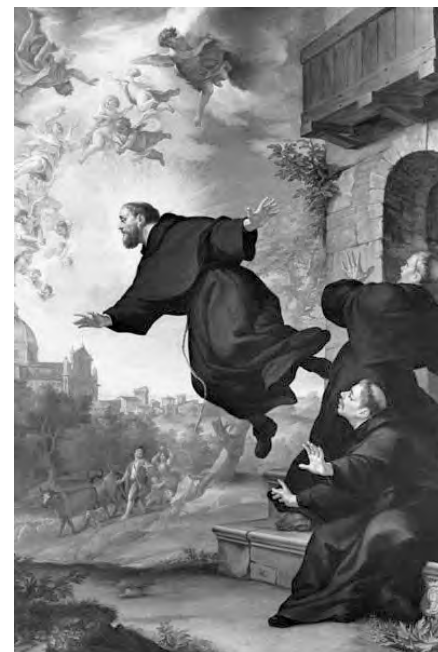
Foto: Sv. Josip Kupernitski u letu, rad Ludovica Mazzantia, XVIII. stoljeće

Velika je odgovornost na onima koji sjede za katedrom. Svoje znanje prikupljeno tijekom njihovog života i studija sada moraju prenositi mlađim generacijama. Svojim stavom prema Istini mogu utjecati na pravac razmišljanja svojih pitomaca i tako utjecati na njihov životni put koji je tek sada počeo. Veliki Benedikt XVI. za mlade govori da su zdrava provokacija . Samim tim zadaća učitelja je produbiti u učenicima njihovu urođenu želju za spoznajom Istine, ali i pokazati im načine kako do nje doći, kako je analizirati, kako je shvatiti, kako se prema njoj ophoditi. Osim toga, nemojmo zaboraviti ulogu odgojitelja koju ima široka društvena zajednica. Crkva, koja uključuje i klerički ali i laički stalež, kao naučiteljica ljudi mora biti svjesna svoje odgovornosti u pripravi novih naraštaja Kristovih učenika. Za to dobro u začetku mora se istinski, nesebično, sebedarno boriti. Dobar biskup, svećenik, redovnik, može svojim primjerom, poštovanjem i odnosom prema vlastitom pozivu usaditi u mlade klicu poštovanja i odnosa koje će ti mladi imati prema zvanju do kojeg će ih Duh sveti u njima i dovesti. Isto to vrijedi i za kršćane laike.