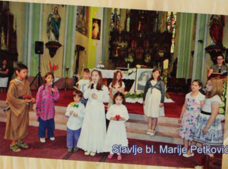
Slavlje bl. Marije Petković u župi sv. Roka u Subotici