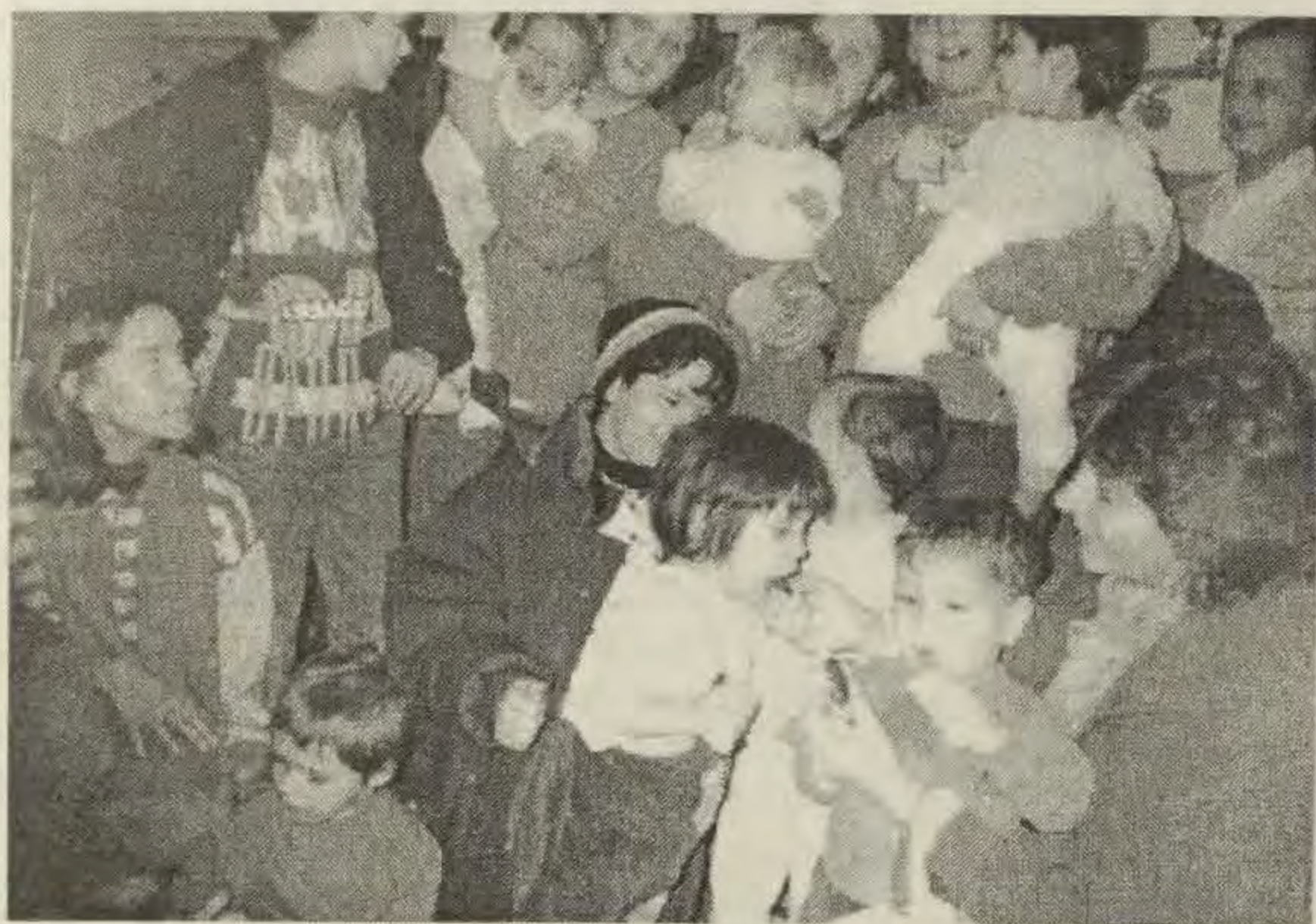
Ovako je bilo u "Kolijevci"

H vala svima koji su nam poslali svoje čestitke za Božić i Novu godinu. Obradovale su nas čestitke vas - najmanjih i najmlađih čitatelja. Dobre želje i blagoslov od Boga želimo i mi svima vama, najdraži Zvončići!