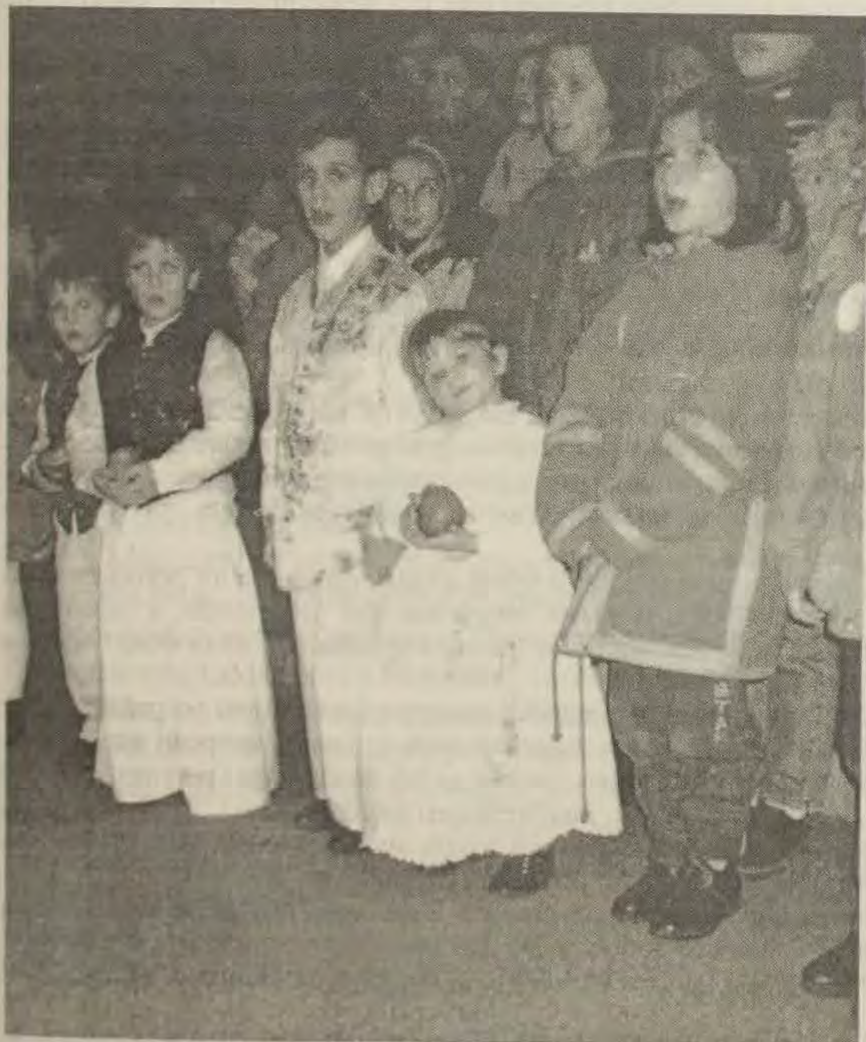
Ovako su najmladi čestitali materice

Prije same akademije djeca su na svoj topao i neposredan način čestitala pjesmom i stihovima materice svim majkama i nanama. Najsimpatičniji su bili najmladi u bunjevačkoj narodnoj nošnji.