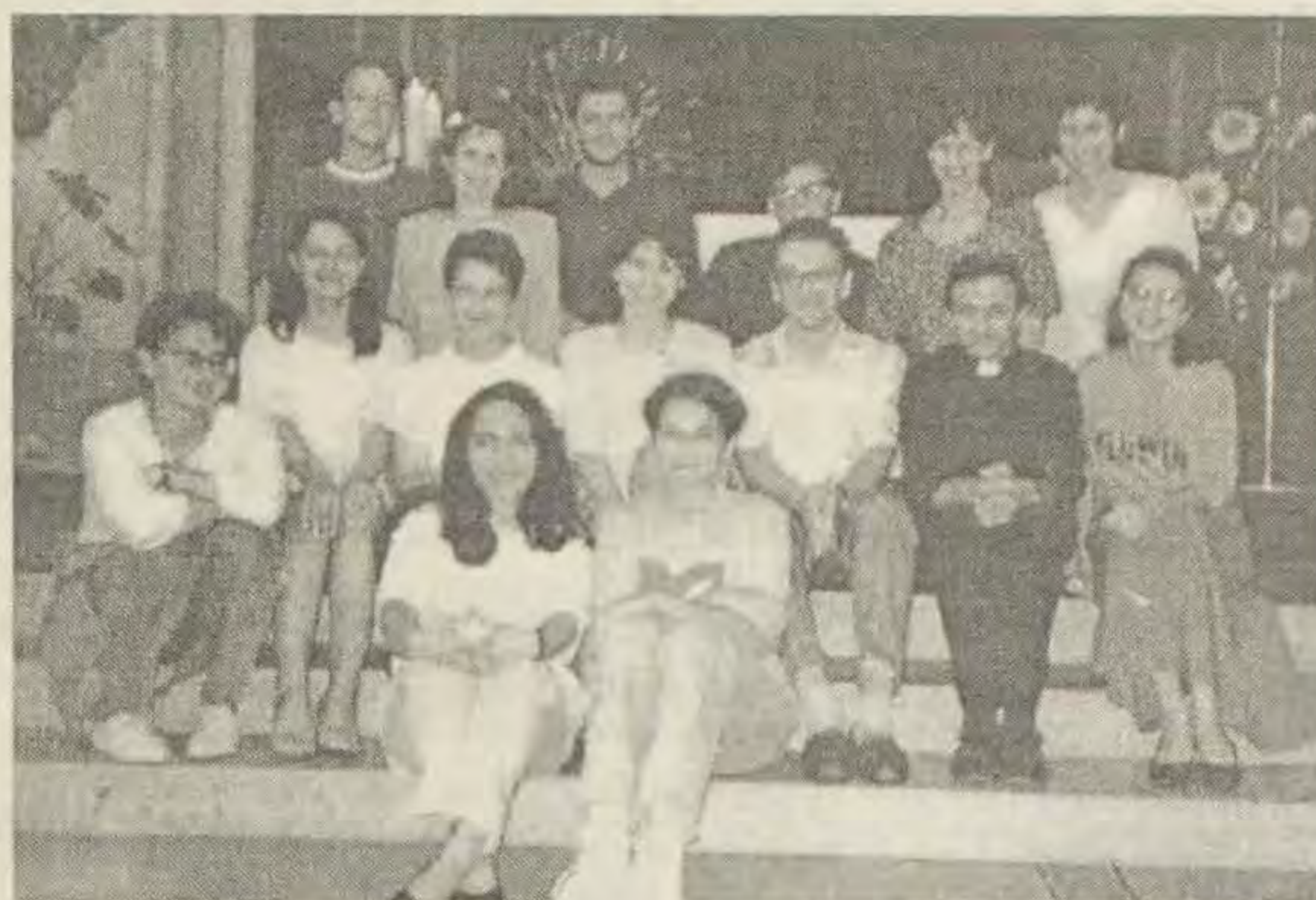
Jedno "izdanje" molitvene zajednice "Betlehem"

Danas je ova molitvena zajednica vrlo aktivna. Broj članova se povećava... Poslije