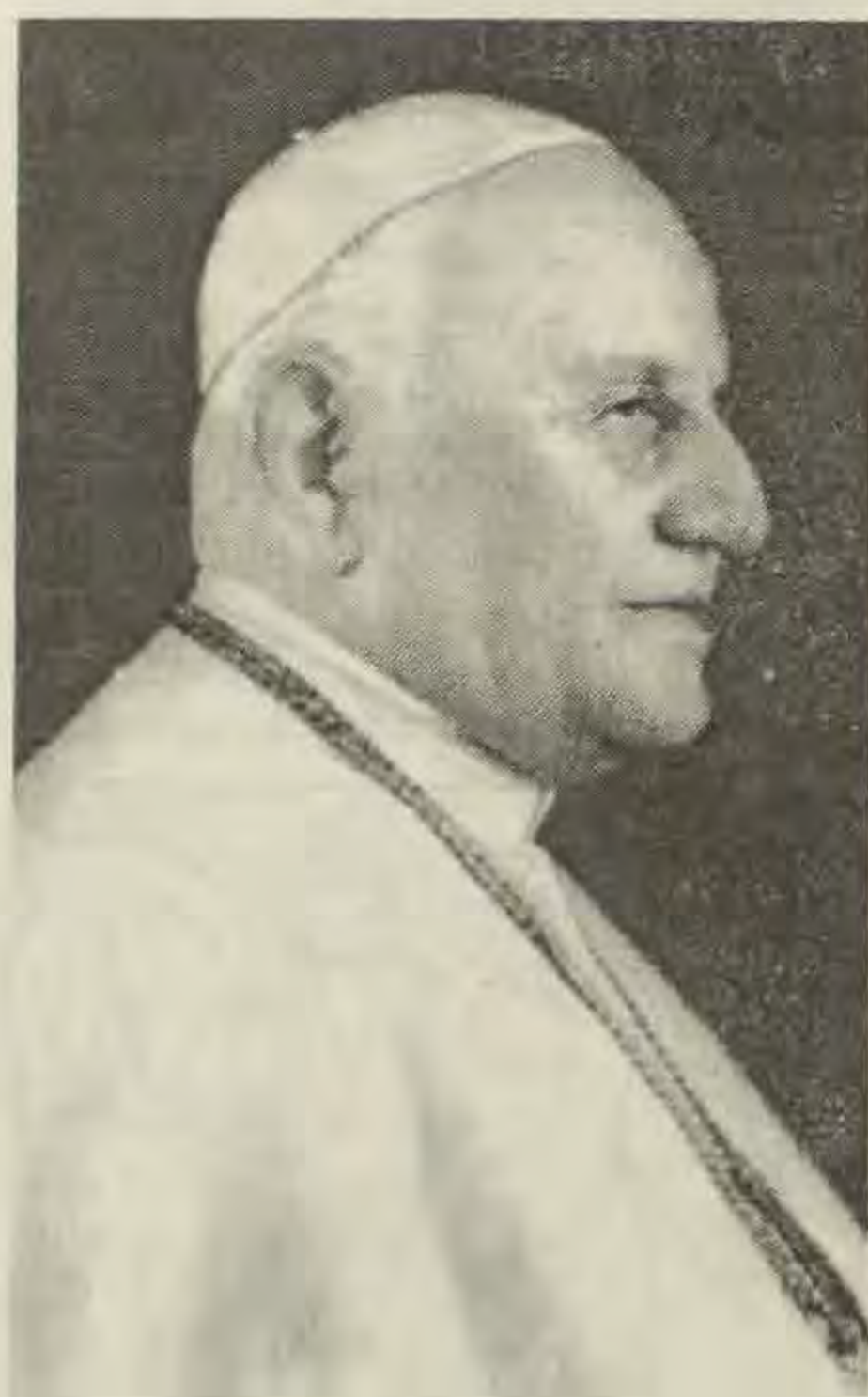
Papa Ivan XXIII.

zvani predstavnici drugih kršćanskih Crkava koje nisu u jedinstvu s Katoličkom crkvom, te predstavnici raznih konfesija nekršćanskih vjerskih zajednica.