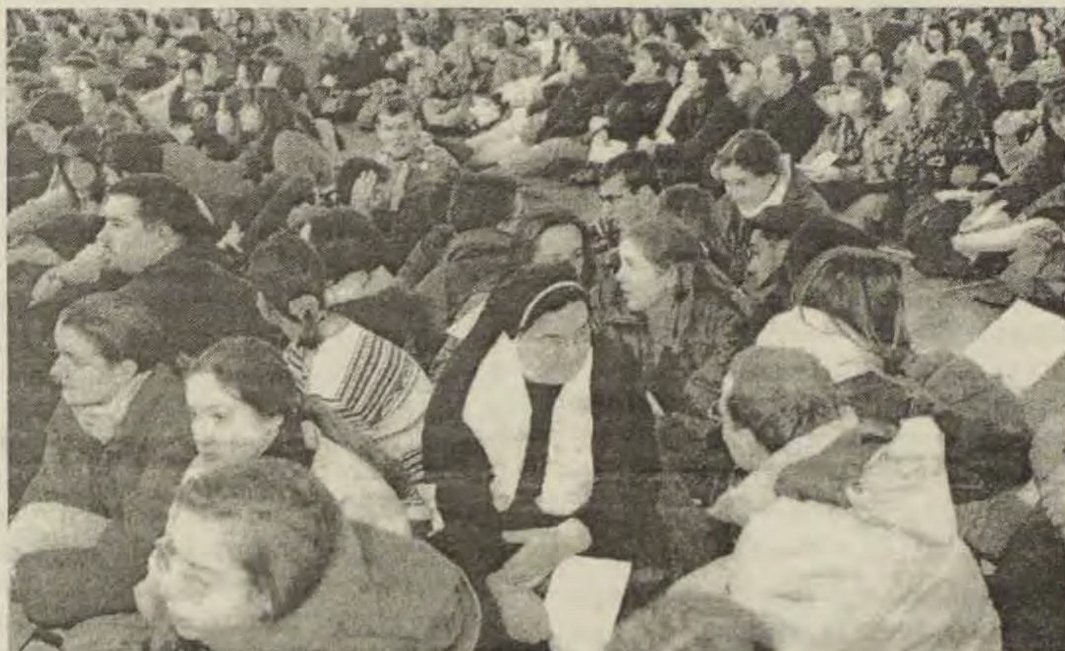
Subotičani na stranicama Stuttgartskih novina