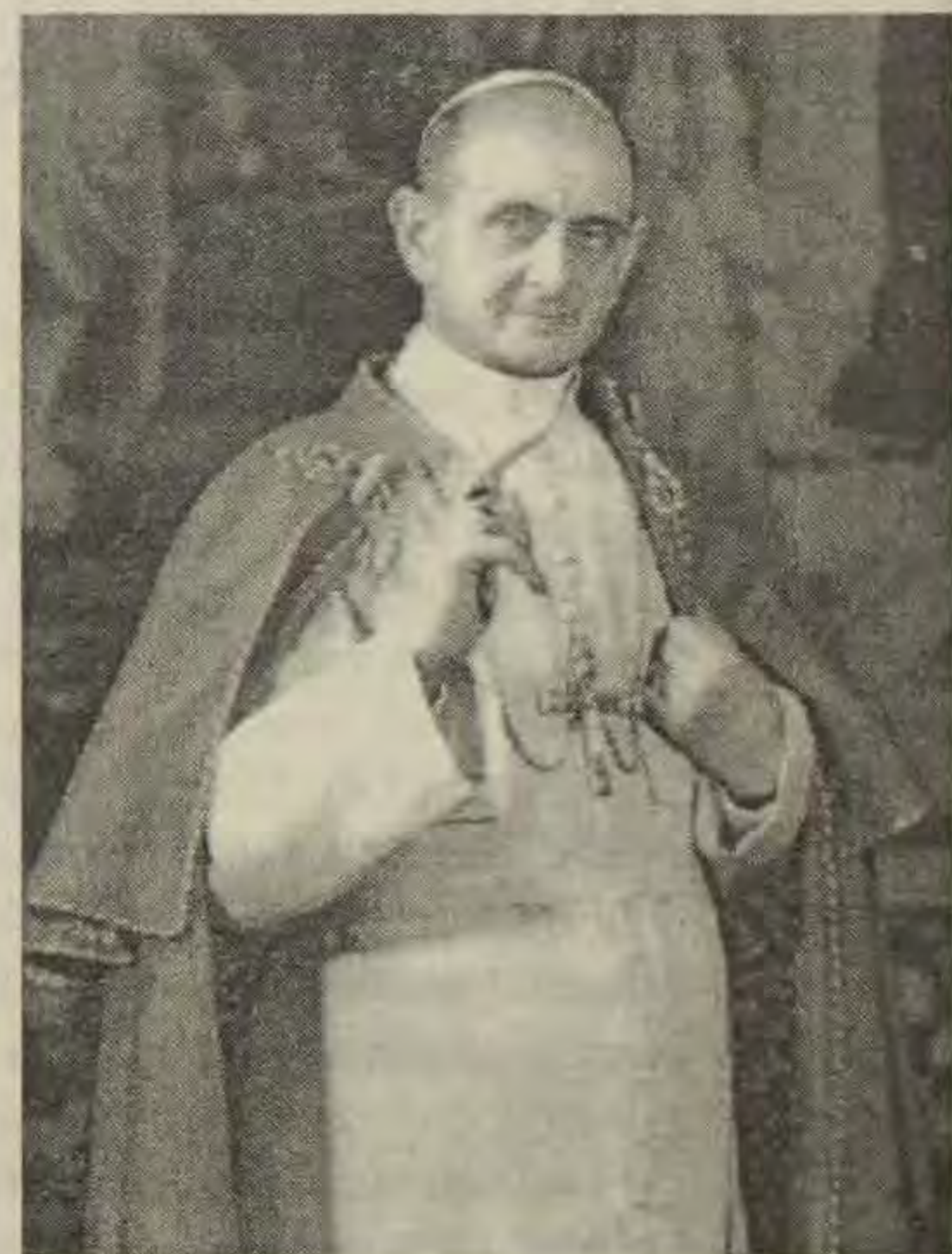
Papa Pavao VI.

Ovaj program sažet u jednoj rečenici odgovara koncilskim konstitucijama, koji je ključ i osovina koncilskih dokumenata: a/ "Crkva" je velika tema II. Vatikanskog koncila, a njezinu bit opisuje