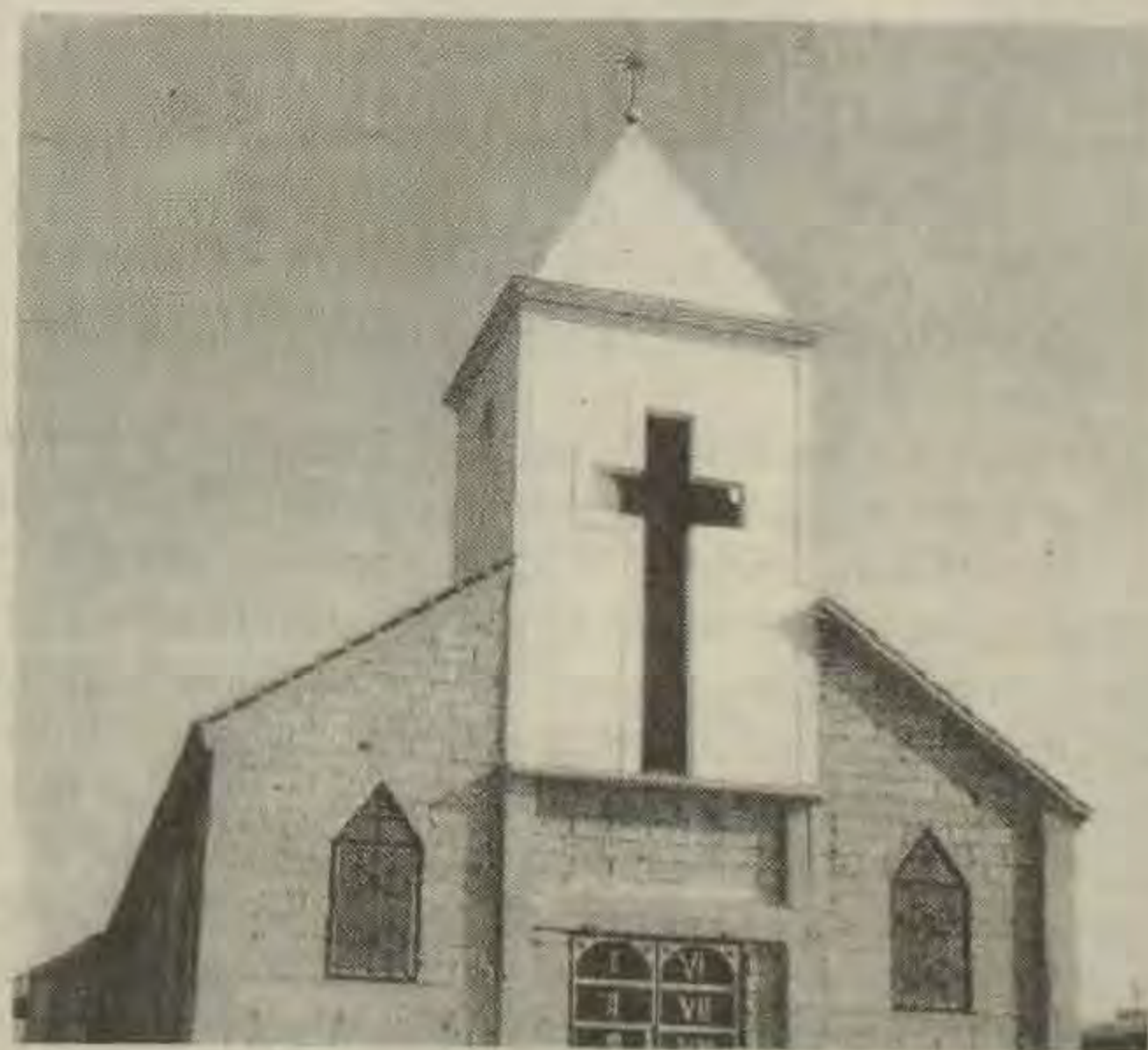
Crkva posvećena albanskim mučenicima u Graždeniku (župa Prizren)